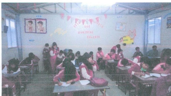
IMAGEN N° 03

Estudiantes desarrollando la encuesta acerca del tema de investigación percepciones y actitudes sobre la sexualidad