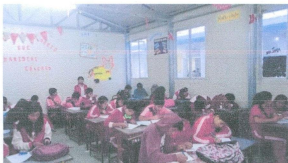
IMAGEN N° 02

Presentación por parte del investigador acerca del tema de percepciones y actitudes de la sexualidad en la I.E. Mariscal Cáceres 5° "A" TT de secundaria.