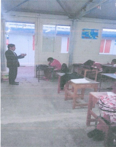
IMAGEN N° 04