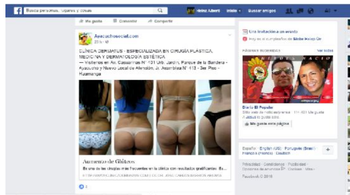
Figura 19 - Exposición de los cuerpos a través de la red social Facebook