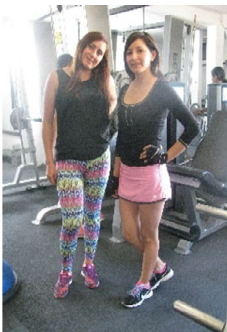
Figura 13 - Presentación corporal de las mujeres. Fuente: Archivo fotográfico del investigador, noviembre de 2016.