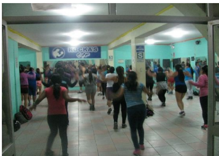
Figura 3 - Gimnasia rítmica para mujeres.