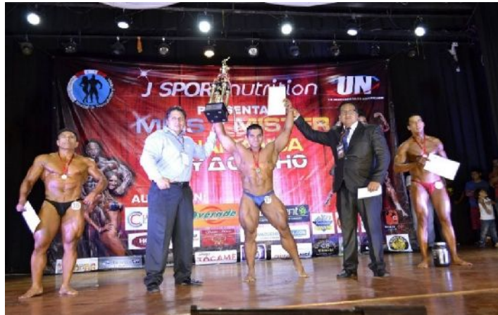
Figura 14 - Presentación y puesta en escena del cuerpo.