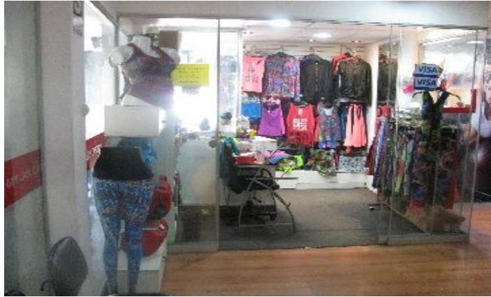
Figura 17 - Accesorios para los ejercicios.