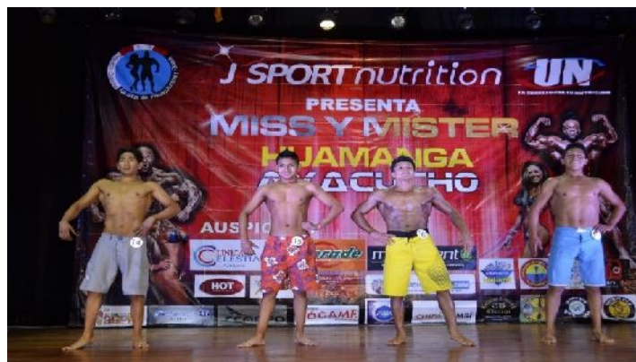
Figura 9 - Cuerpo en proceso de transformación.

En la figura N° 9 podemos observar los cuerpos en procesos de construcción, y que con una disciplina e inversión se podrá lograr el objetivo.