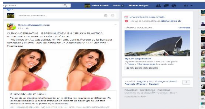
Figura 20 - Exposición de los cuerpos a través de la red social Facebook

De mismo modo mencionar que existen ofertas de las clínicas de belleza donde se presenta de manera visual un antes y después en la estética del cuerpo femenino. Esta visualización impacta e induce a tener dichos cuerpo mediante las intervenciones quirúrgicas en la nalga, tanto en mujeres como varones. Esta parte del cuerpo de la mujer marca, por así decirlo, en esta sociedad sexuada, la sensualidad que pudiera tener estas mujeres.