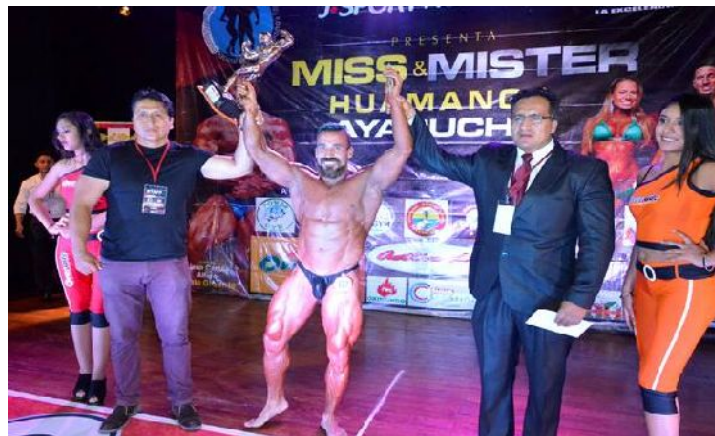
Figura 8 - Cuerpo trabajado en base a disciplinas

Para este grupo el manejo de la disciplina, como elemento de control y docilización del cuerpo, se dejará de lado. Querer conseguir un buen “ performance corporal ” será de manera fácil e inmediato, ya que existen productos de permiten ganar masa muscular en poco tiempo como los anabólicos. “Las características de la posmodernidad, señala Denegri, son: inmediatismo, fragmentalismo, superficialismo, facilismo” (2015). En tal sentido, la facilidad e inmediatismo son elementos que configura el cuerpo de los no disciplinados.