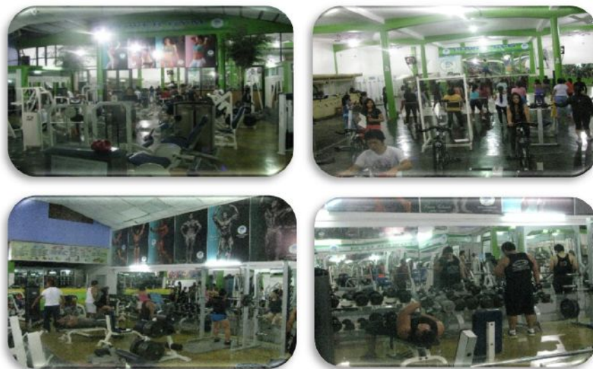
Figura 5 - Espacios de preparación corporal.