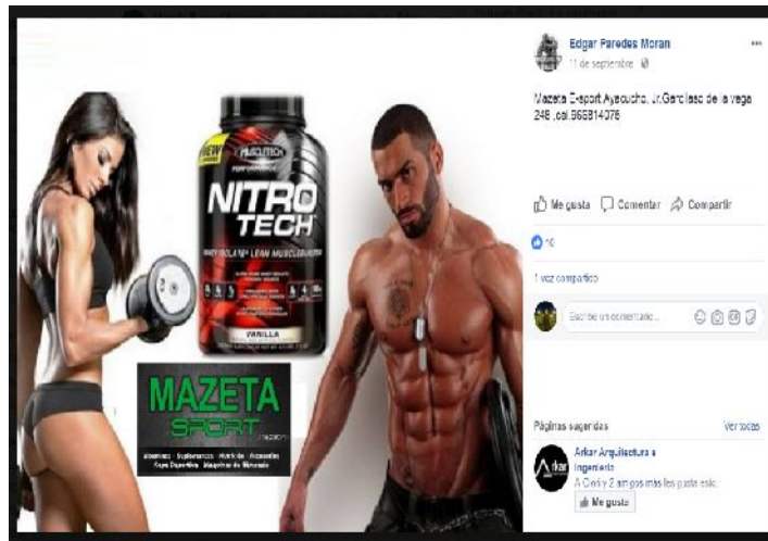
Figura 11 - Suplementos alimenticios que consumen los cultistas.

La manera de consumir estos suplementos (que por cierto no son anabólicos como muchos podríamos creer) es después de cada ejercicio porque después de ello los músculos quedan lesionados y maltratados por lo que se necesita de inmediato