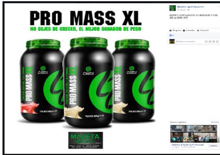
Figura 10 - Suplementos alimenticios que consumen los cultistas.

Entonces, de acuerdo a nuestros informantes, los suplementos alimenticios son indispensables dentro de la construcción corporal del joven, poder evitar así cualquier lesión en la integridad física del cuerpo.