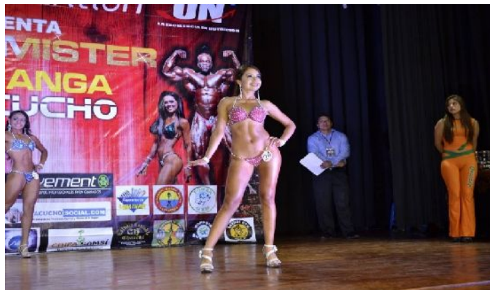
Figura 15 - Presentación y puesta en escena del cuerpo.