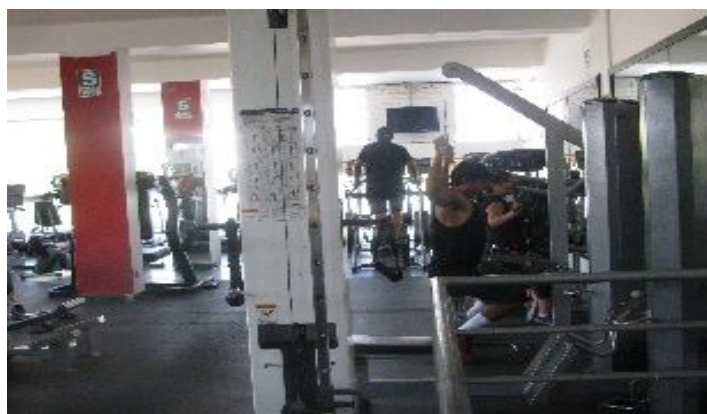
Figura 16 - Entrenamiento en el perfeccionamiento del cuerpo. Fuente: Archivo fotográfico del investigador, noviembre de 2016.