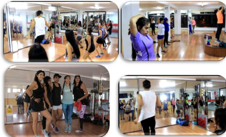
Figura 6 - Espacios de preparación corporal.