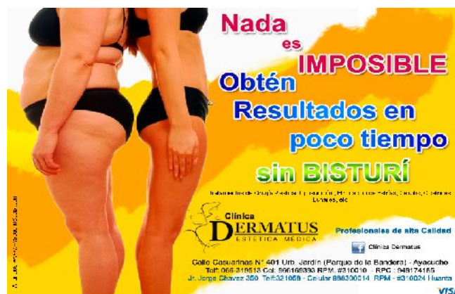
Figura 23 - Cuerpo ideal de acuerdo a los medios comunicacionales.

Según la expresión de este entrenador motiva a los demás jóvenes al ejercicio físico diario y su mejora en el fortalecimiento de sus músculos señalando que todos pueden llegar a tener un cuerpo presentado siempre en cuando se dediquen a esta práctica.