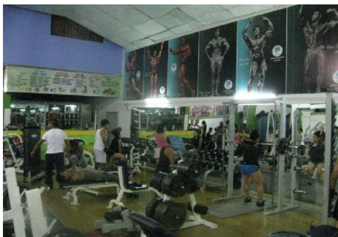
Figura 12 - Entrenamiento en el perfeccionamiento del cuerpo.