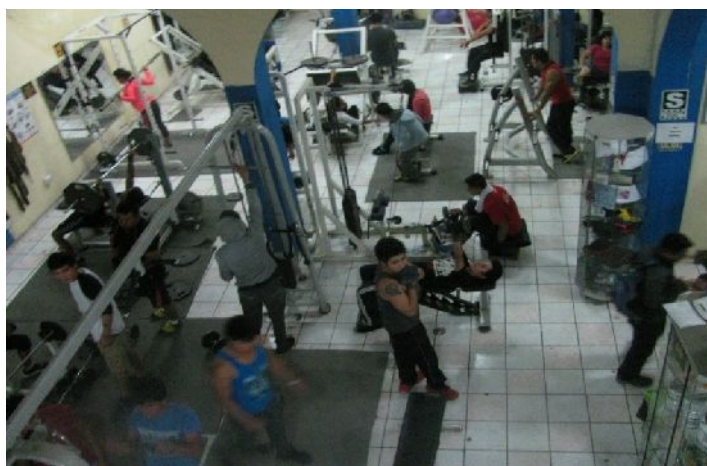
Figura 4 - Espacios donde se esculpen los cuerpos.

Fuente: Archivo fotográfico del investigador, noviembre de 2016.