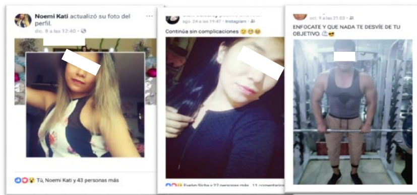
Figura 18 - Exposición de los cuerpos a través de la red social Facebook

Es interesante esta expresión porque resalta el uso de los celulares como una necesidad de comunicación virtual bajo una multiplicidad comunicacional (Facebook, Instagram, Twitter, WhatsApp, etc.) de esta manera sus vidas privadas se hacen públicas bajo el afán de mantener una comunicación permanente y, de acuerdo a Daniel Bell, vivimos dentro de una “cultura visual”.