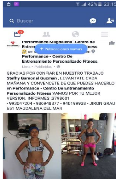
Figura 22 - Anuncios publicitario por las redes sociales incitando a asistir a los gimnasios.

proceso del tiempo presentarse bajo otra manera ante su perfil de Facebook. En la foto posterior muestra el resultado de su presentación personal, donde ha realizado constante ejercicio y en su alimentación.