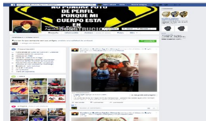
Figura 21 - Deseos de tener cuerpos trabajados.

Esta fotografía hace evidente a la voluptuosidad de la mujer en la presentación de los senos los cuales en cierta medida para los varones constituyen una atracción sexual.