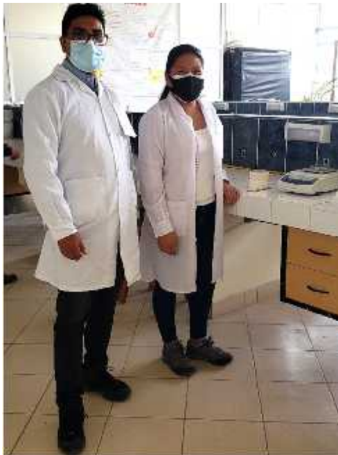
Foto 2. Personal Encargado para el Análisis Físico- Químico y Microbiológico en la Calidad de Agua.