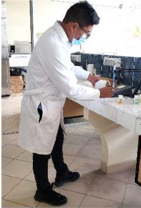
Foto 1. Análisis de Muestra de Agua en el Laboratorio Servicios Analíticos Generales S.A.C.