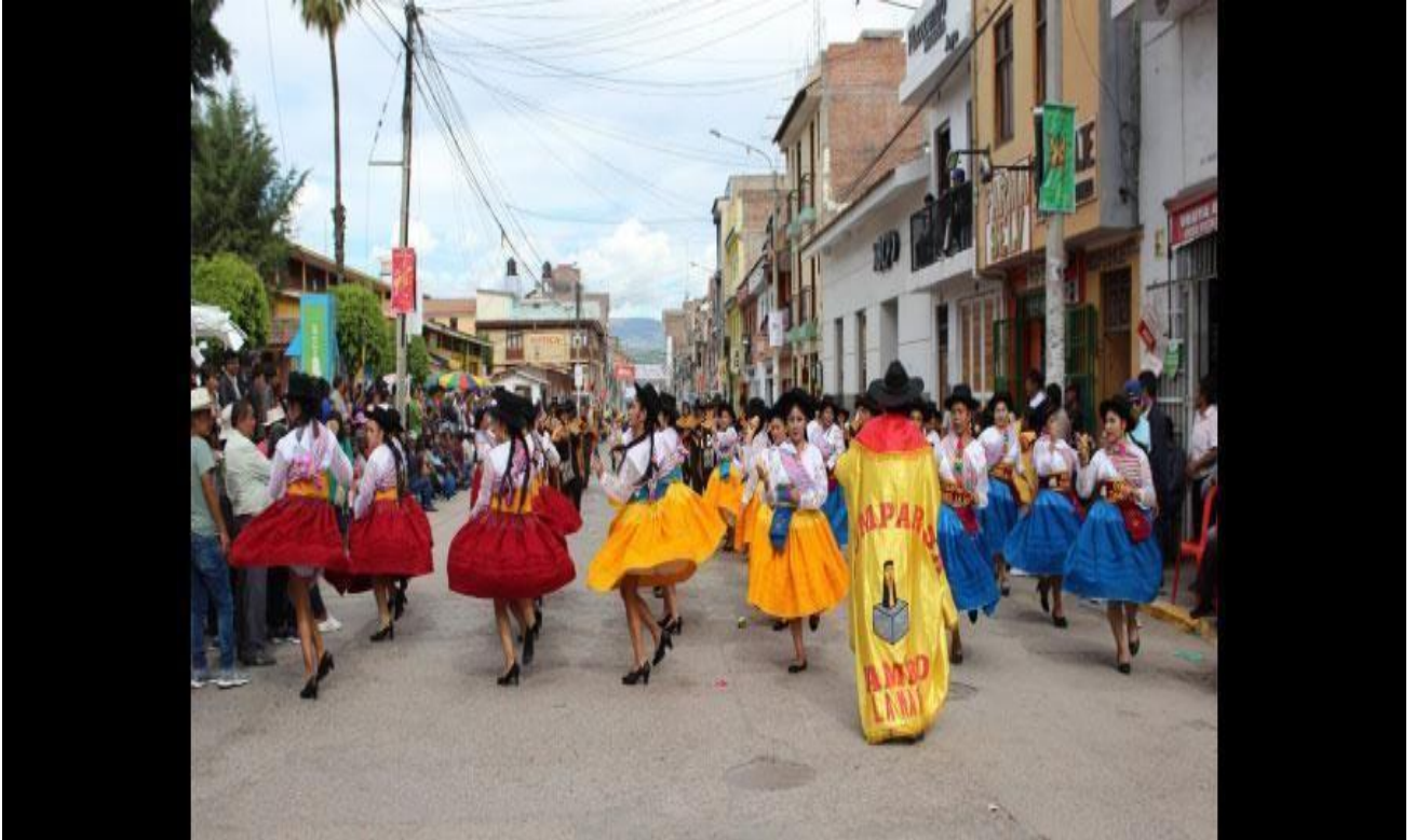
- Comparsa Tambo tras su paso por la Magdalena.

Los días domingos 3 y lunes 4 carnaval, las comparsas más populares, las más conocidas, de los barrio y familias huamanguinas salieron a las calles para mostrar que la esencia de las fiestas carnestolenda sigue vigente en las nuevas generaciones combinados con la modernidad actual.