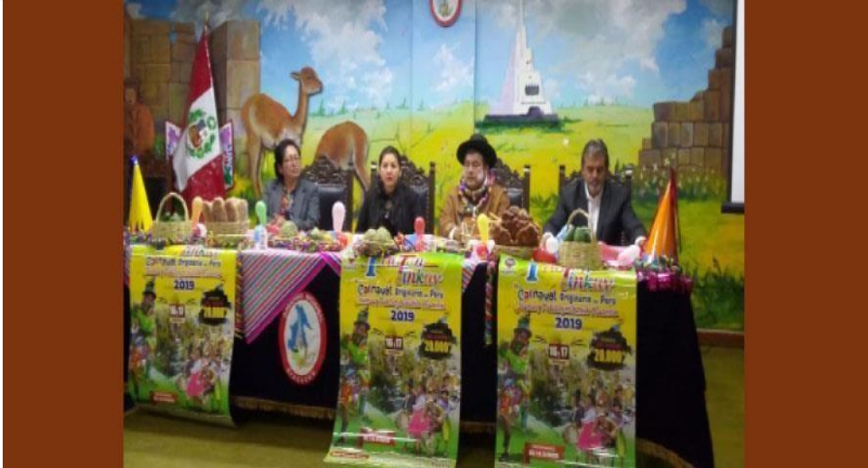
- Lanzamiento del Hatun Tinkuy 2019.