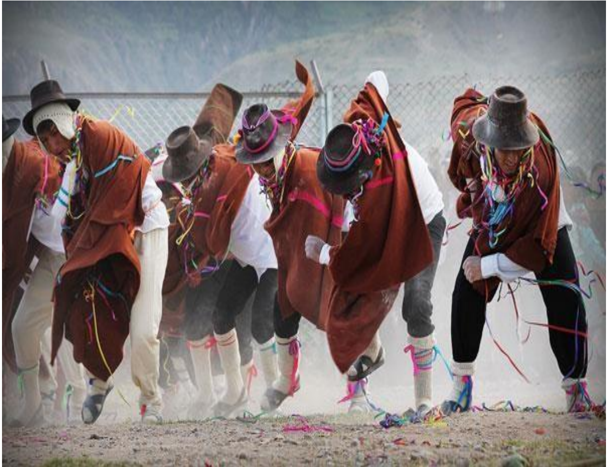
Lanzamiento del carnaval ayacuchano en Lima