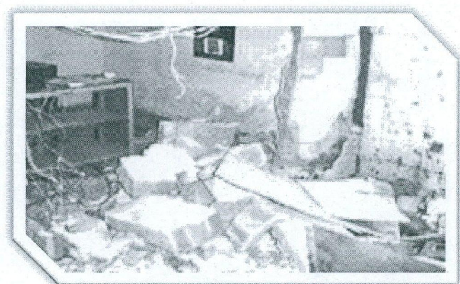
ATENTADO A RADIO LA VOZ DE HUAMANGA 1