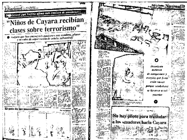
Diario La República, 6 de junio de 1988, pp. 2-3. Ed. 2,346

El diario La República en la edición 2,346, del 6 de junio de 1988, publica en la portada con el encabezado siguiente, Jefe del Comando Ayacucho afirma ante comisión del Senado... “ENSEÑABAN TERRORISMO A NIÑOS”, la nota periodística fue abordada en la página 2 – 3, con el siguiente titular, “Niños de Cayara recibían clases sobre terrorismo”.