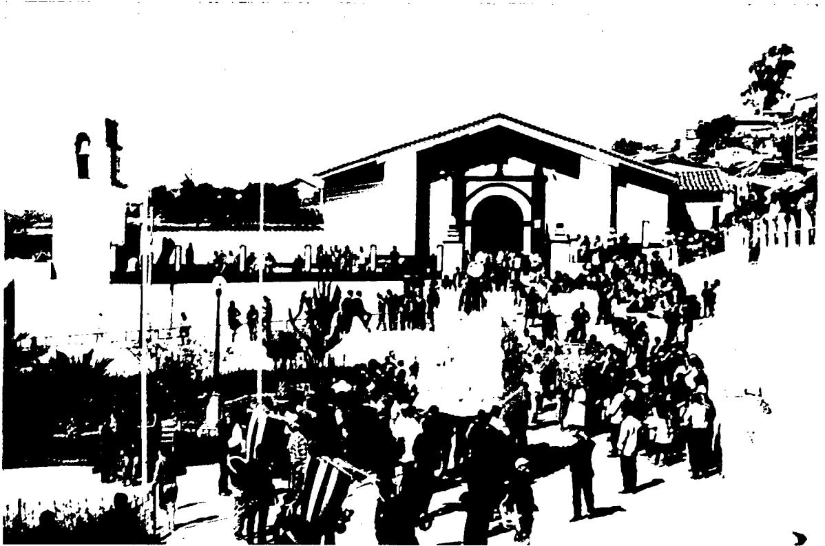
Foto 1: El distrito de Cayara, foto tomado por Yuri Huaynalaya Jayo, 24 de junio del 2015, en conmemoración al patrón San Juan Bautista.

El distrito de Cayara tiene como anexos a las comunidades, Pirhuacho, Huayroro, Yanarurocc, Atahui, Villa Parcocha, Huallhuani, Huaccacca, Erusco, Pampa Corral, Paquiscca Pampa, Tantarpuquio, Hualla Pata, Mayopampa, Chincheros, Chaupiccata, Piccqapuquio, Occopampa, Ccayocucho, Chihuinsa, Huamacco, Ruyaccacca, Calvario, Hillapata, Ccechua 59 .