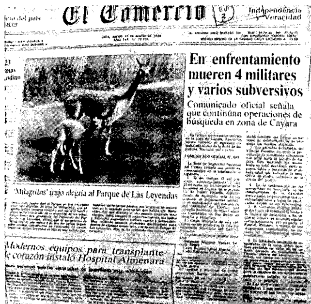
Diario El Comercio, 19 de mayo de 1988 pp.1 – portada. Ed.79,102