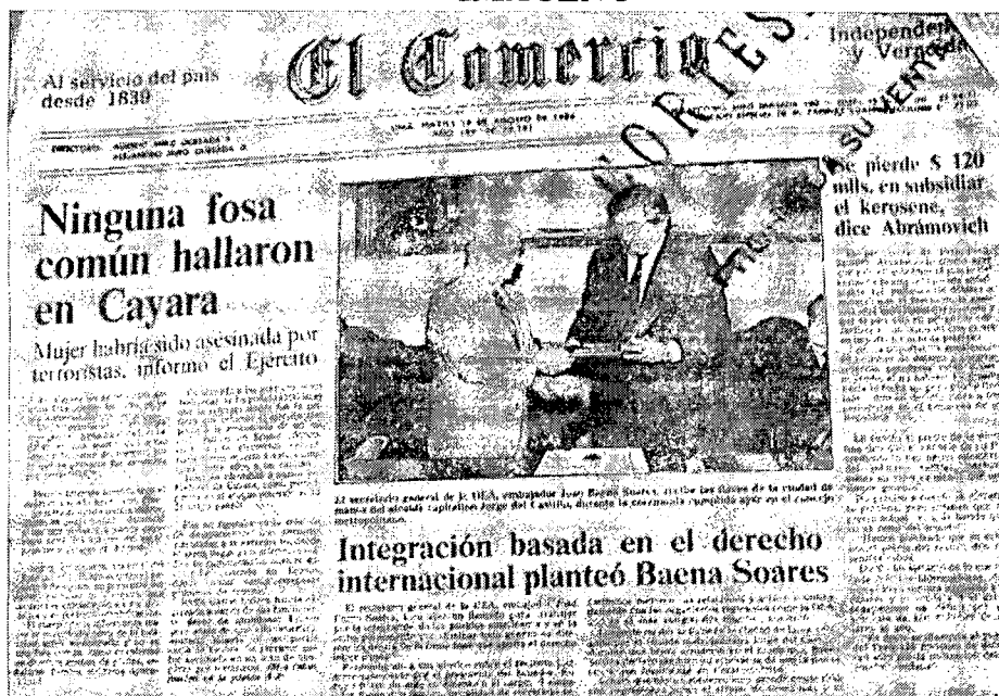
Diario El Comercio, 16 de agosto de 1988, pp.1 – portada. Ed. 79,191.

En la portada de la edición 79, 191, del diario El Comercio, con el titular “Ninguna fosa común hallaron en Cayara”, señala que “En Cayara no se encontró ninguna fosa común, tal como se venía sosteniendo. Únicamente se ubicó, en un paraje cercano a esa localidad, el cadáver de una mujer, que actuó como informante del Ejército, por lo que se presume fue asesinada por terroristas” 164 .