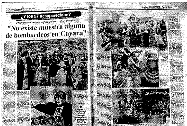
Diario La República, 22 de mayo de 1988, pp. 2-3. Ed. 2,331

Un nuevo hecho, ocurrido en el distrito de Cayara, cometido por los miembros del Ejército peruano. Se trata de una matanza de campesinos cayarinos quienes fueron asesinados por efectivos militares, como muchos hechos similares fueron ocultados por las instancias correspondientes, en esta ocasión la Presidencia del Consejo de Ministros comunica a través de su portavoz, Armando Villanueva del Campo, quien sostiene, fue “supuesta matanza” en dicho distrito. El diario La República con la finalidad de generar contradicciones sobre las posturas del caso Cayara, publica las declaraciones del portavoz: