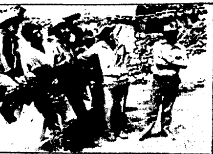
Fusiles semi-automáticos, en poder de elementos subversivos y otros tipos de armas y explosivos, fueron recuperados por efectivos militares en Cayara y Moyopampa. En otros poblados de Cayara, que en un momento fueron considerados como 'zona roja', se recuperaron armas y explosivos, así como también se recuperaron otros tipos de armas y explosivos.