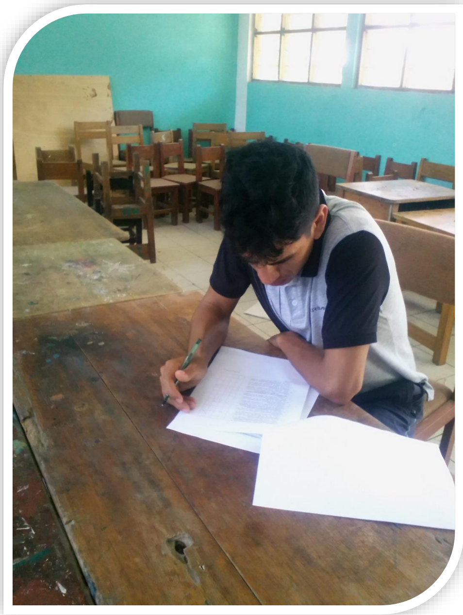
Docente del centro poblado Puerto Amargura resolviendo preguntas del cuestionario en la Institución Educativa Pública Modesto Bastidas Espinoza