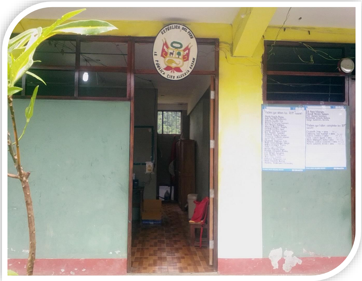
Dirección de la Institución Educativa Pública 'Ciro Alegría Bazán', en el centro poblado de Mayapo, Llochegua