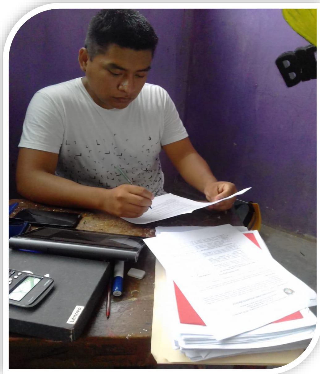
Docente del centro poblado de Mayapo resolviendo preguntas del cuestionario en la Institución Educativa Pública Ciro Alegría Bazán