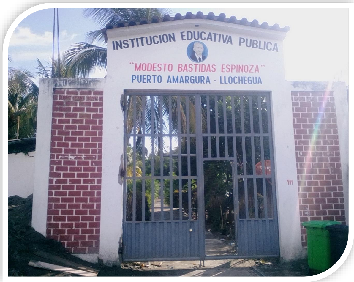
Institución Educativa Pública Modesto Bastidas Espinoza, en el centro poblado de Puerto Amargura, Llochegua