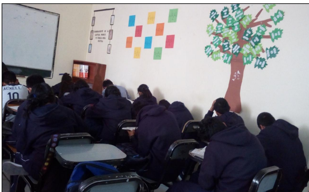
Estudiantes desarrollando el cuestionario