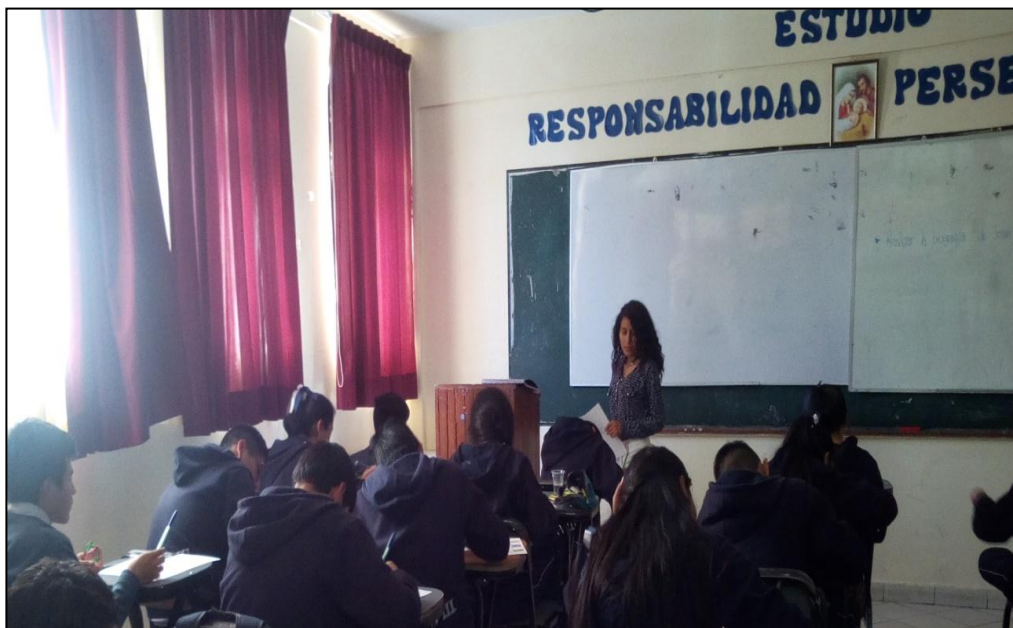
Investigadora aplicando los instrumentos de evaluación