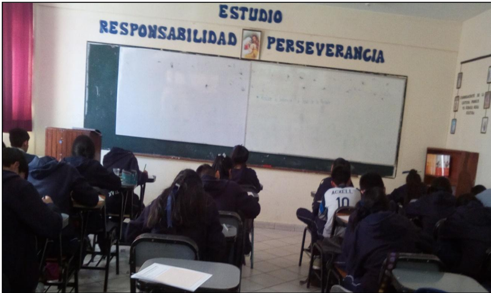
Estudiantes redactando textos argumentativos