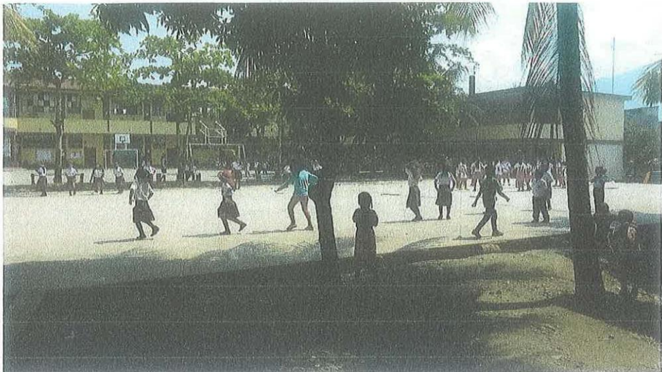
INSTITUCIÓN EDUCATIVA 38678/Mx-P SIVIA