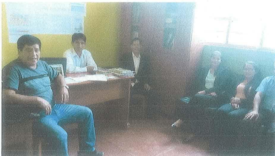
APLICACIÓN DEL CUESTIONARIO