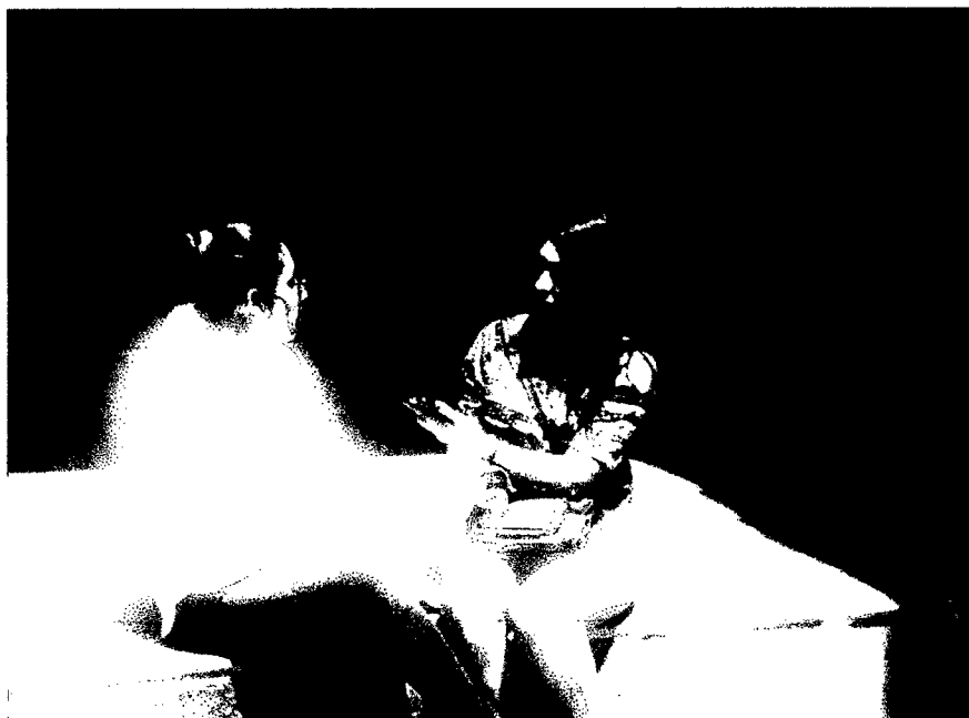
Foto: Presidenta del Colectivo de Lesbianas, Gays, Transexuales, Bisexuales e Intersexuales – LGTBI de Ayacucho. Entrevitada el 21 de julio de 2016

No estoy segura de que las feministas participen en estos temas en la mesa de concertación pero si nos han apoyado en la marcha por el orgullo, incluso la Defensoría del pueblo apoya para estas causas y el principal obstáculo con respecto a este tema era que la organización se encontraba disuelta y no contábamos con quienes se hagan cargo de estos temas.