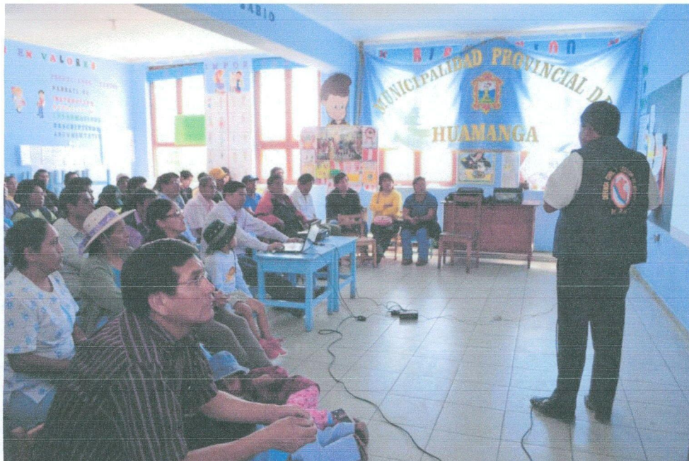
Exposición de actividades ejecutadas en el Hatun Rimanakuy en Santa Ana.