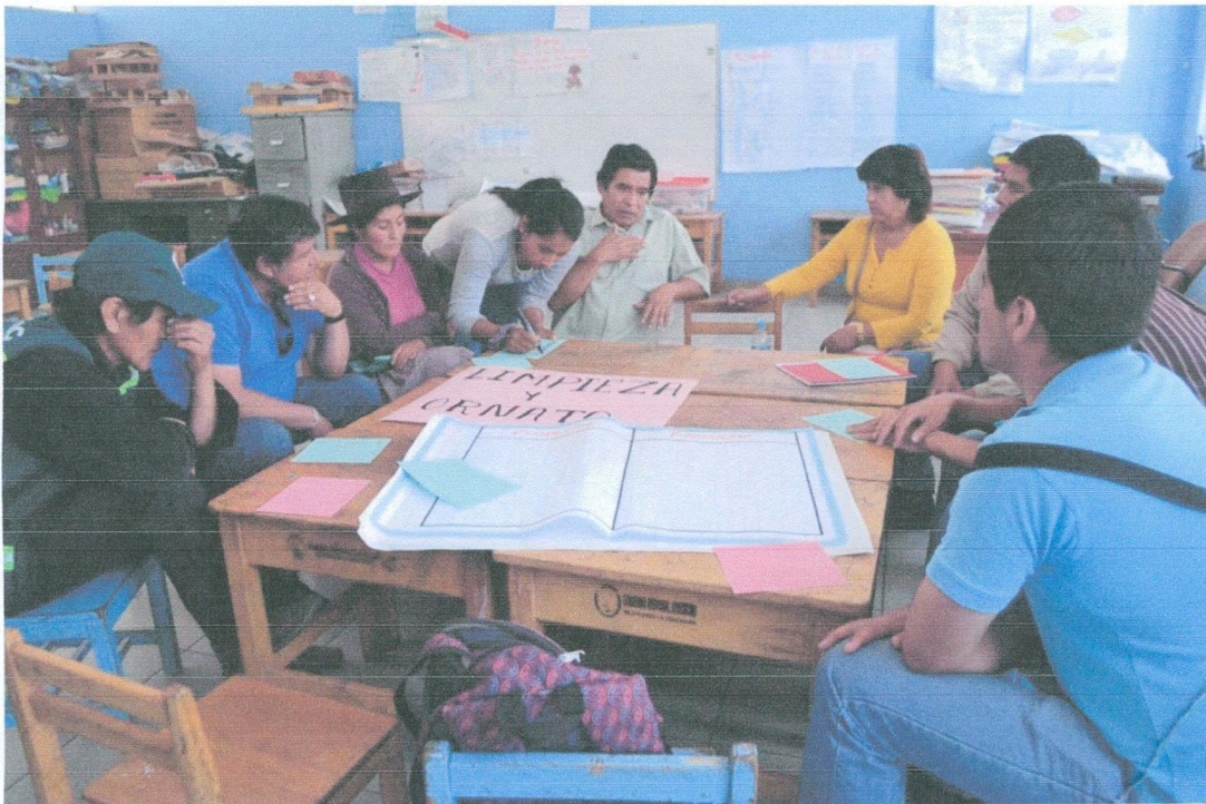
Taller de priorización de demandas y formulación de propuestas de solución.