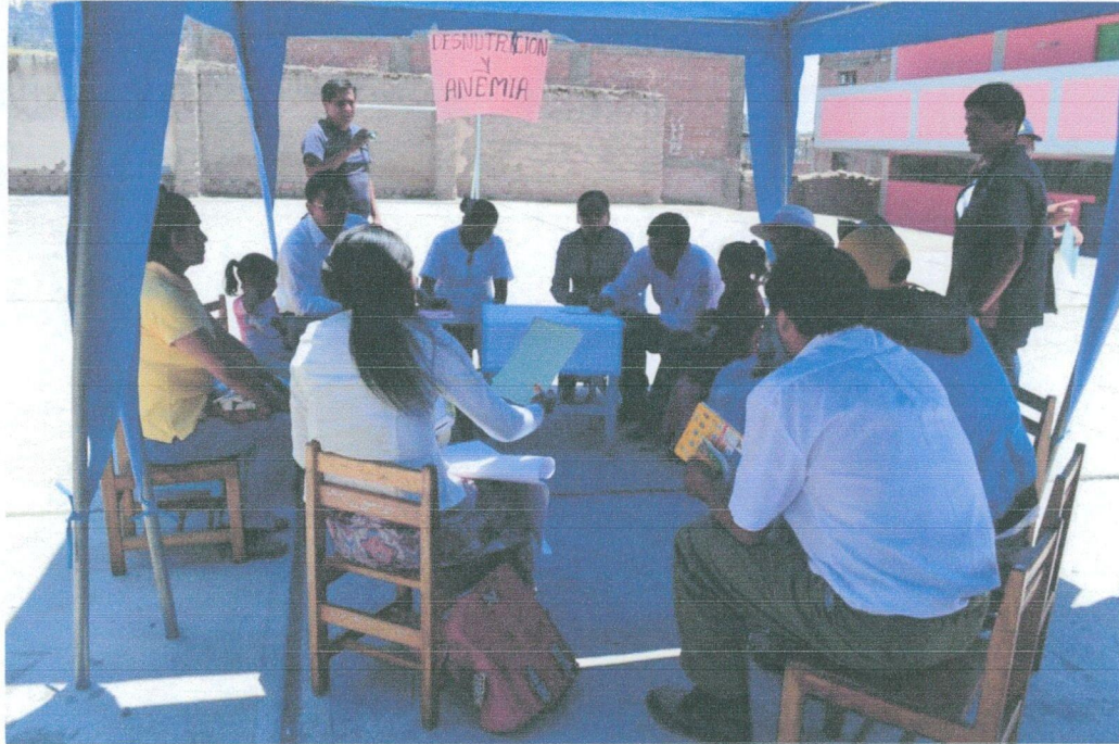
Taller de priorización de demandas en la I.E. Santa Ana.