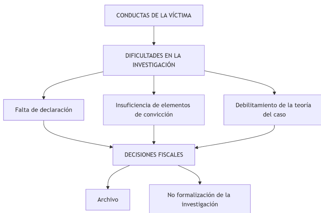
Figura 3 Incidencia en la investigación y decisiones fiscales