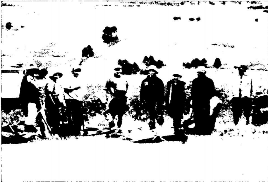
Contratistas y peones con las respectivas herramientas de trabajo