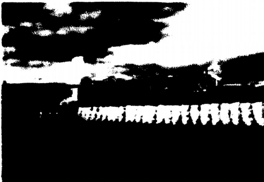
FOTO N° 06: Cosecha de papa y su embolsamiento, dispuesto para el transporte hacia el mercado