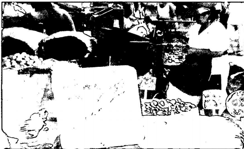
El movimiento económico en el mercado de Lima