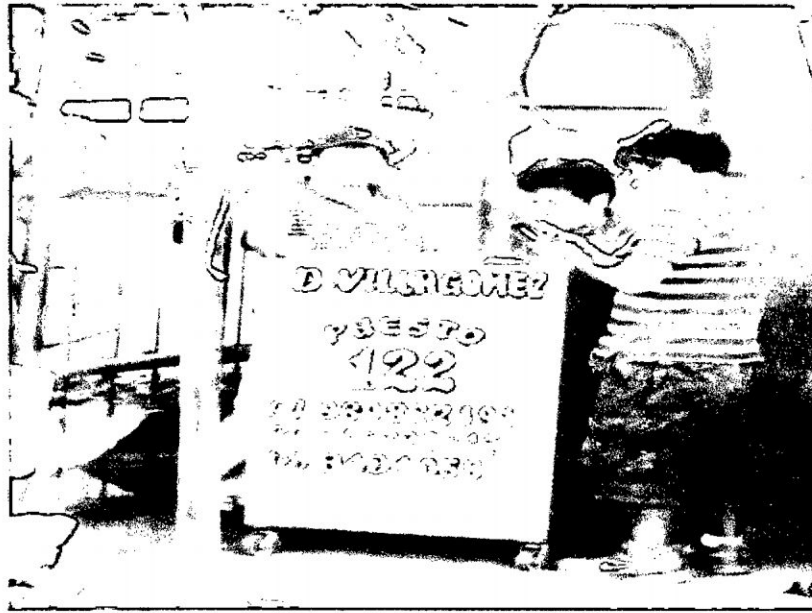
Mayorista de MM N° 01 LIMA - Arreglando cuentas con el cliente papero de Manallasacc