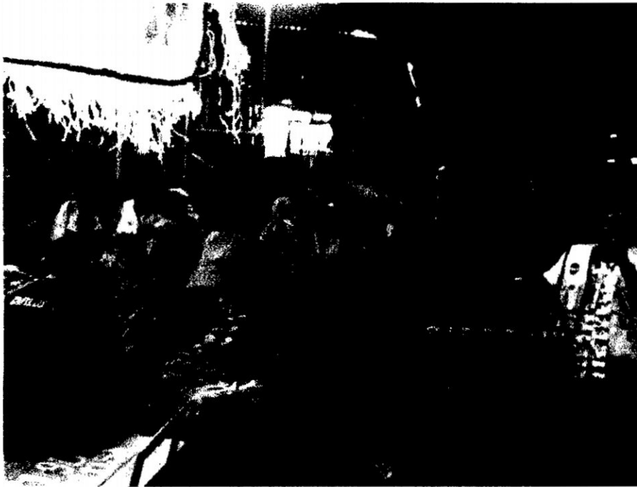
Panorama de un puesto del mercado No 01. La Parada-Lima