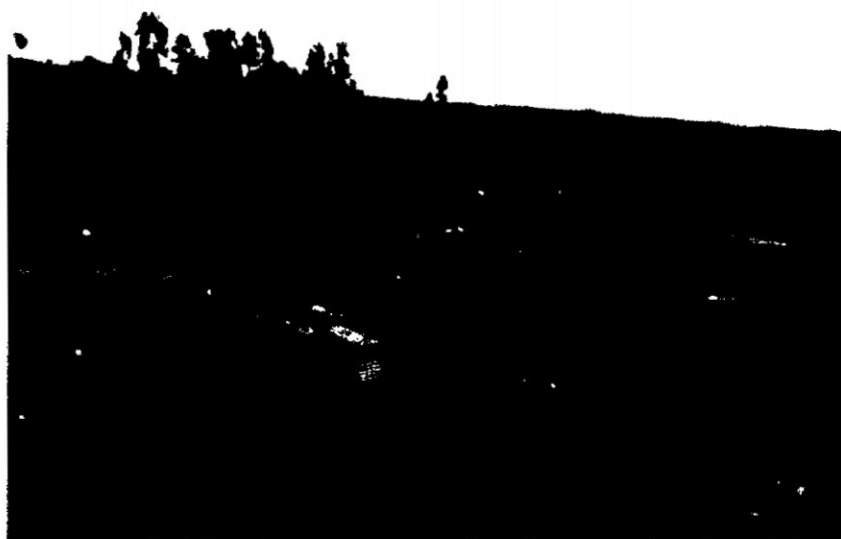
FOTO N° 09: Embalaje y envío de la papa en trailer, propiedad de algunos productores, con apoyo de trabajadores estacionales.

Dentro de este proceso, cabe agregar el uso del transporte, como un medio importante para el traslado de los diversos productos, orientados por la actividad agrícola y la posterior comercialización; la ausencia de este medio imposibilitaría el movimiento de insumos y enseres necesarios para las diversas actividades agrícolas, así como el transporte de productos hacia a puntos de comercialización (Mercado N° 1 La Parada). Hacen uso de camiones de carga de 30 TM de diferentes empresas de transporte, establecen convenios anticipados para el transporte hacia el mercado limeño. Para aminorar los costos, estos agricultores se han agrupado en cooperativas, beneficiándose el 80 % de los socios con la compra de los camiones, lo que disminuye los costos en gastos operativos.