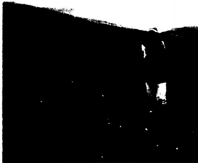
FOTO N° 03: Muestra del cultivo de papa, en terreno llano, con uso de fertilizantes químicos.