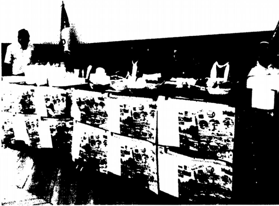
FOTO N° 03: Conferencia—exposición de las autoridades de Manallasacc en la gobernación de Ayacucho sobre diversidad y calidad de productos agrícolas de Manallasacc.