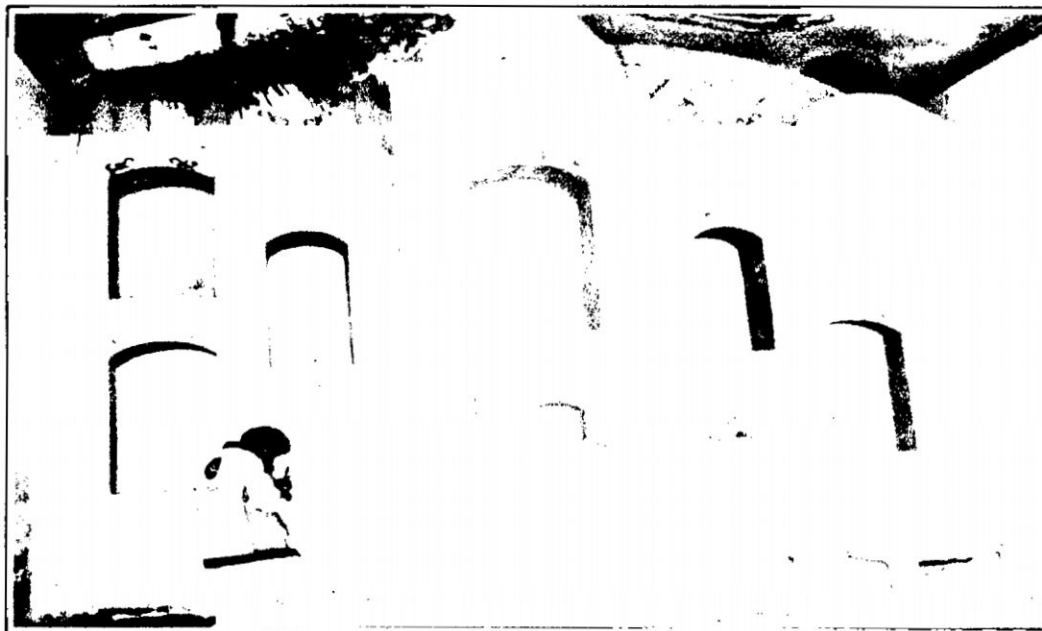
FOTO N° 02: Altar de la antigua iglesia católica, en el antiguo pueblo de Manallasacc

Callpana, el mismo se encuentra en las alturas del río Accomayo, a una distancia de tres kilómetros del actual centro urbano de la comunidad.