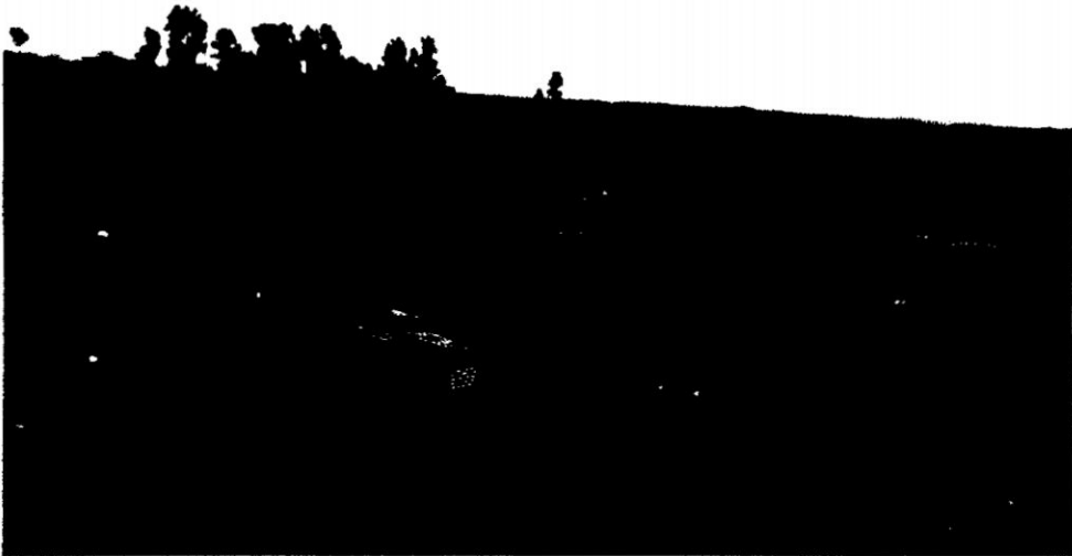
Realizando el transbordo al camión para el destino final, mercado de Lima