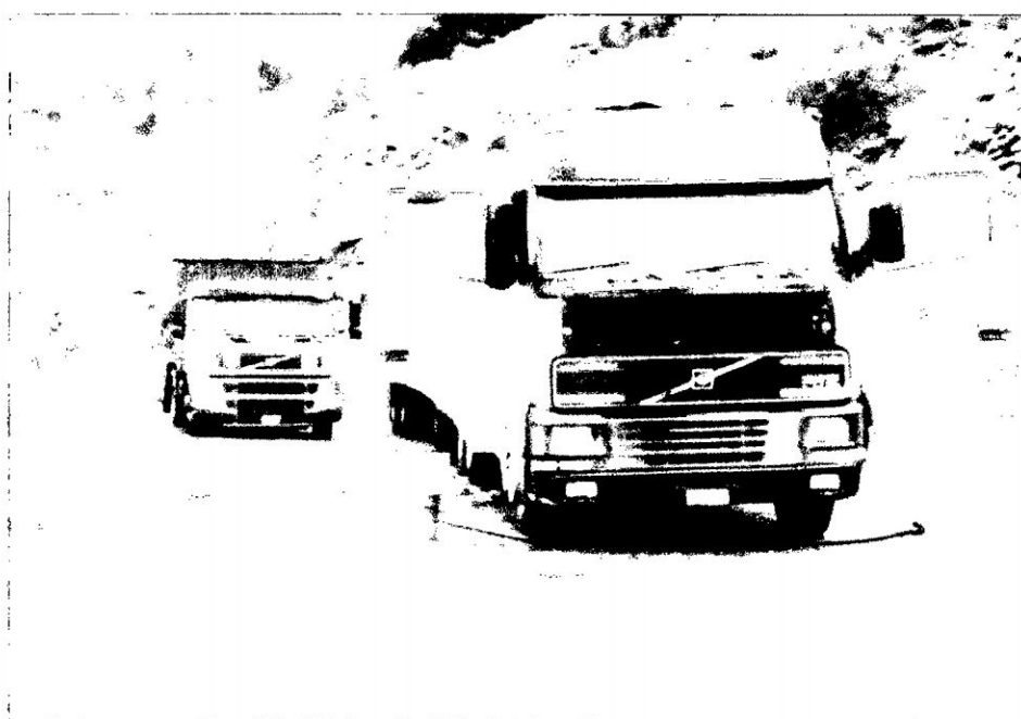
FOTO N° 11: Uso de vehículos para el transporte de la papa, con volumen de producción, muchos de ellos propiedad de los productores agrícolas

La formación de estos nuevos sectores agrícolas, interpretando las palabras de Efraín Gonzales de Olarte (1994; 46), tratarían constantemente de desarrollar una nueva actividad agrícola orientada hacia al mercado. Sin embargo, el ingreso al mercado pleno no lo podrían alcanzar, desde la lógica campesina comunitaria, la integración plena de este desarrollo se manifiesta dentro de una racionalidad capitalista, donde estos productores agrícolas conocen de la actividad que realizan; así como las ventajas económicas que acumulan.