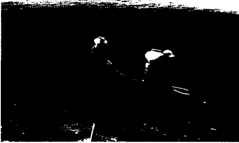
Fumigacion por aspersión, con el uso de mochilas, del cultivo de papa después del daño causado por una granizada