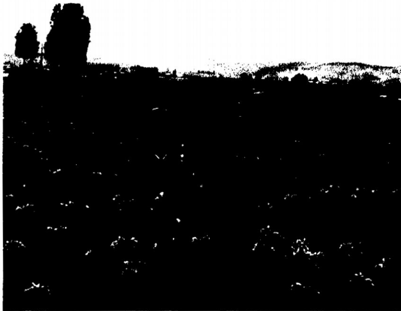
FOTO N° 05: Variedad de papa yungay en plena floración en Manallasacc