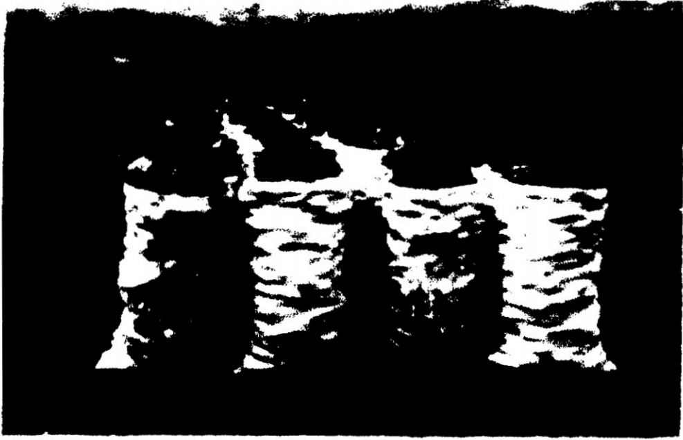
Acopio de papa en envases con marca (Papa Buena de mi Tierra)