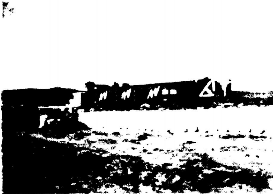
Cosecha de papa para el posterior traslado al mercado de Lima