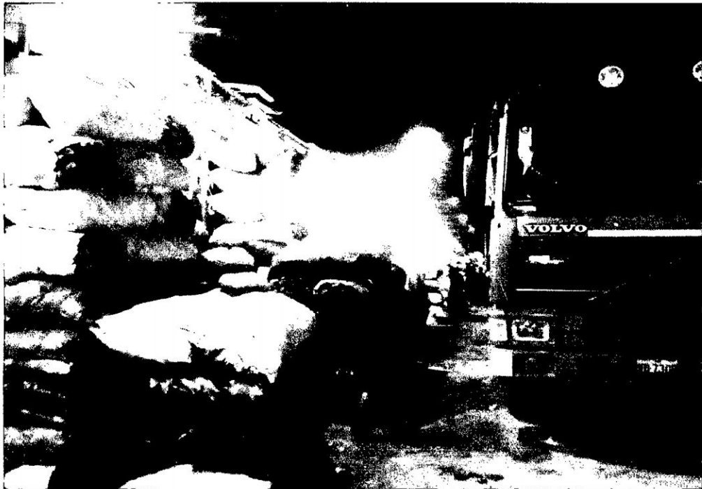
Camión descargando papa en el MM. N° 01, procedente de Manalíasacc