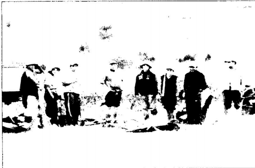
FOTO N° 04: Trabajadores asalariados estacionales provenientes de otros lugares en un momento de descanso durante la cosecha.