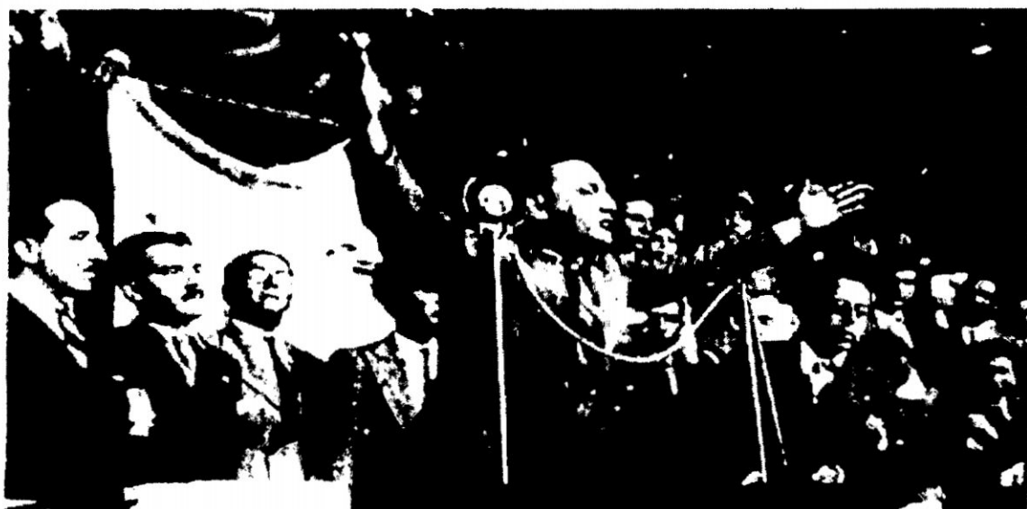
Victor Raúl Haya de la Torre se dirige al público en la plaza de toros de Lima, en 1933