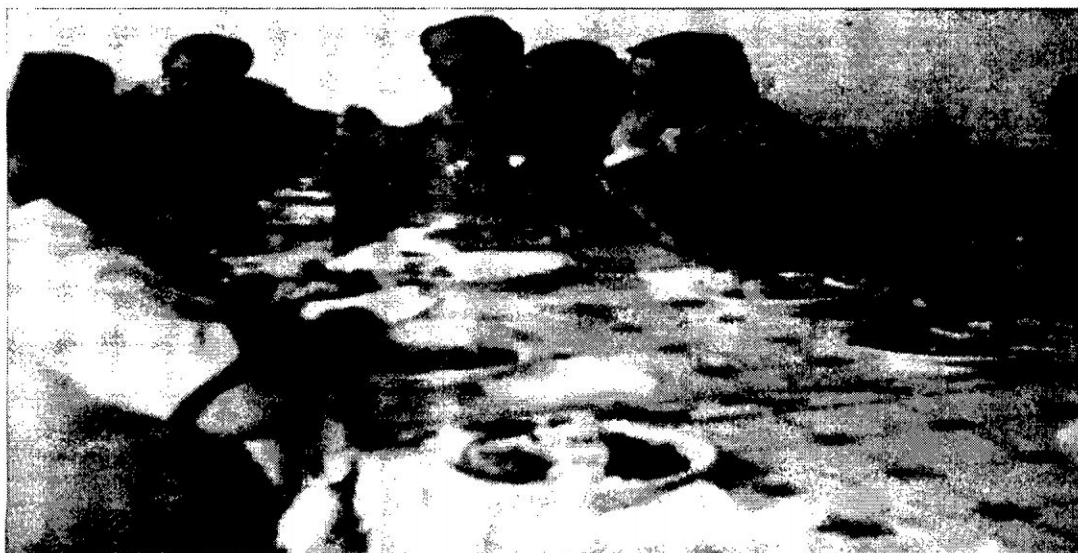
En la Hacienda Tinajeras de la Familia Meléndez con el candidato presidencial de 1980 don Armando Villanueva