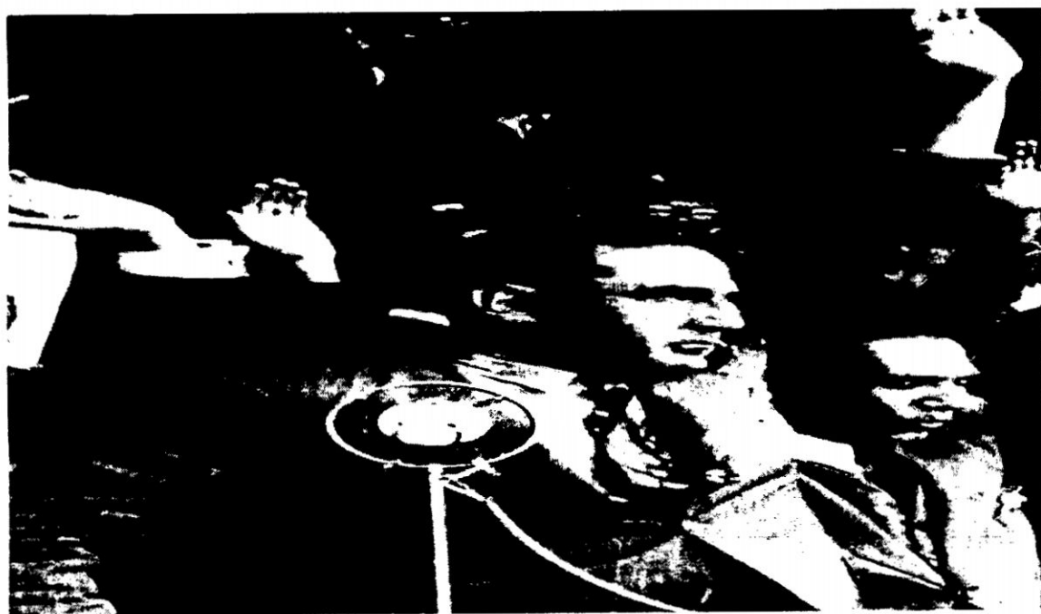
Victor Raúl Haya de la Torre en la década de los treinta