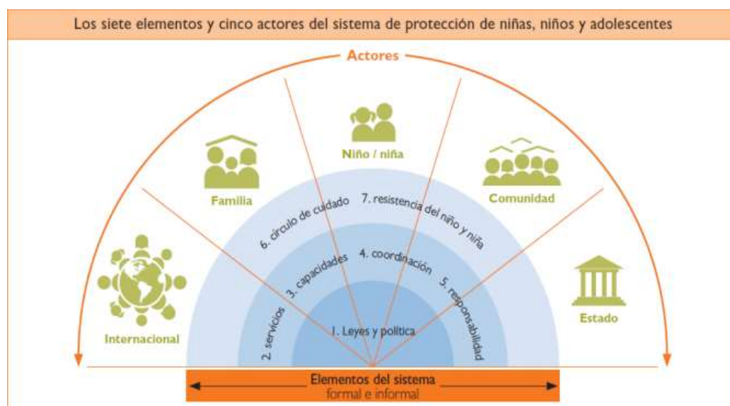
Figura 1 - El sistema de protección en el marco World Visión Internacional

Nota: World Vision Internacional (2011). Herramienta ADAPT, P.5.