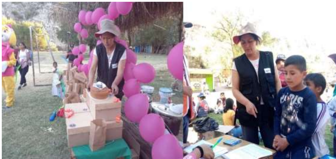
Figura 9 -Acompañamiento de las voluntarias en la “Celebración de cumpleaños”

Nota: Archivo fotográfico de la investigadora, diciembre de 2022.