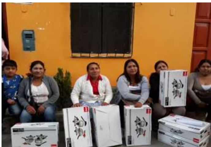
Figura 5 - Gestión para entrega de utensilios a los comedores populares.

Según el relato de la entrevistada, inicio su trabajo sensibilizando a los pobladores sobre el objetivo de World Visión señala que fue una tarea difícil, así mismo organizo a los niños para que participen de manera responsable y permanente de las actividades que realizaron con los niños.