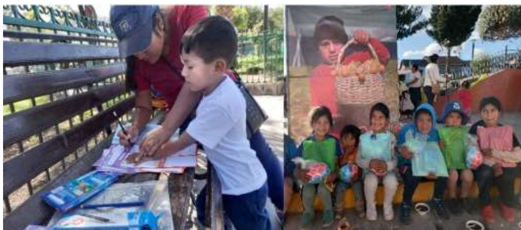
Figura 8 - Elaboración de las cartas con el acompañamiento de las voluntarias