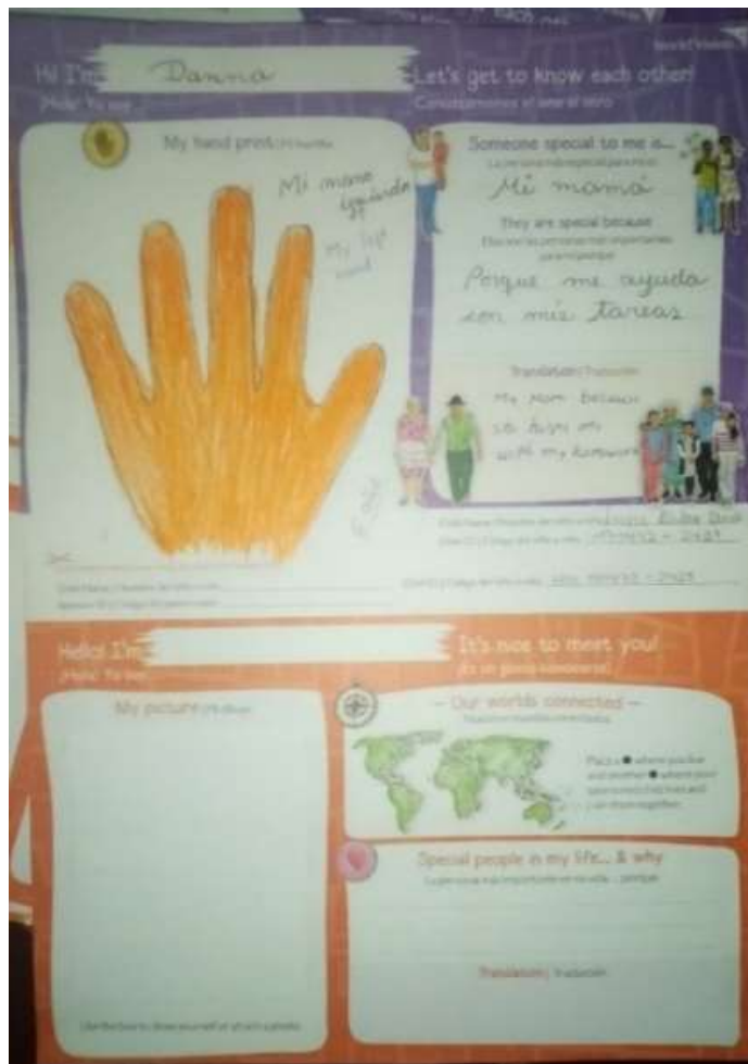
Figura 7 - Carta de saludo de niño/a de 0 a 3 años para el patrocinador/a.