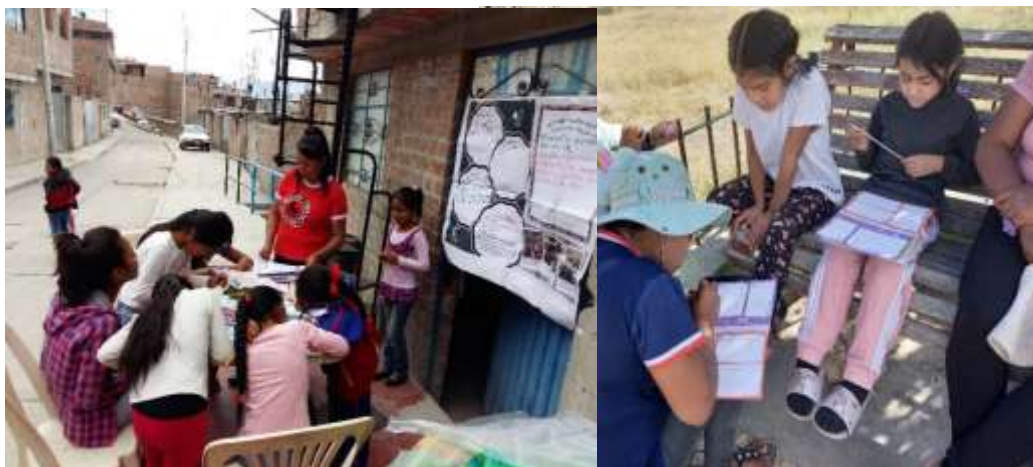
Figura 8 - Elaboración de las cartas con el acompañamiento de las voluntarias