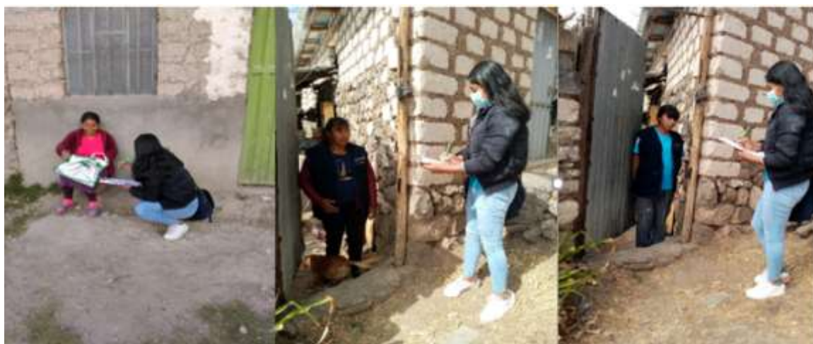
Figura 3 - Entrevista a las voluntarias de World Vision.

Nota: Archivo fotográfico, noviembre de 2022.