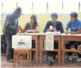
Los pobladores elegirán a sus autoridades