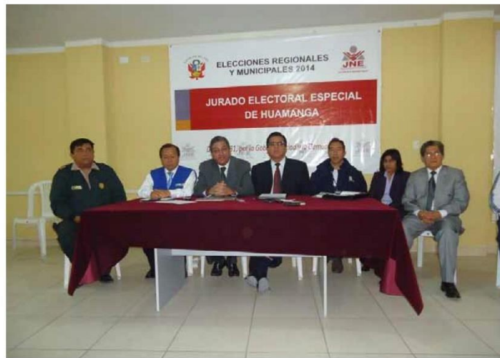
►Autoridades dieron a conocer las labores que cumplirán.

De acuerdo a la Ley Orgánica de Elecciones, según el Artículo 390 las sanciones para aquellos que no cumplan con estas medidas son