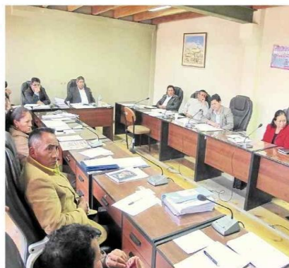
Concejales se despiden en dos meses de la comuna huamanguina