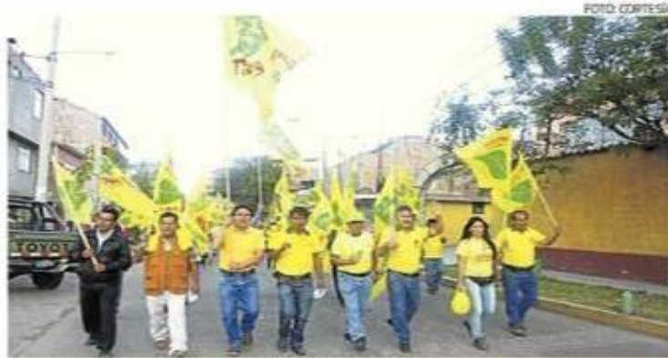
Militantes apoyaron lanzamiento de candidatos

Herencia y Huilcahuari lideran candidaturas