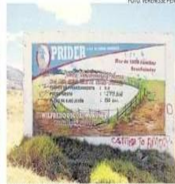
Utilizan obras públicas para promocionarse

prohibidas de difundir mensajes expresos o subliminales destinados a promover, auspiciar o favorecer candidaturas. Asimismo, durante los noventa días previos al día de las elecciones, todo funcionario público que sea can-