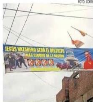
Los pasacalles invadieron calles de Nazareno