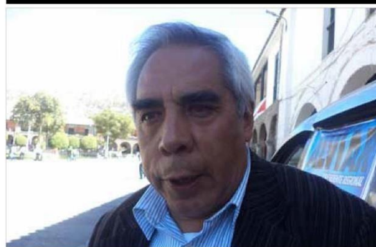
>Candidato del 'choclo' afirma que hay mucho por hacer.

► Afirma que falta mucho por hacer en la región. "¿Dónde están las obras si están paralizadas?" cuestionó.