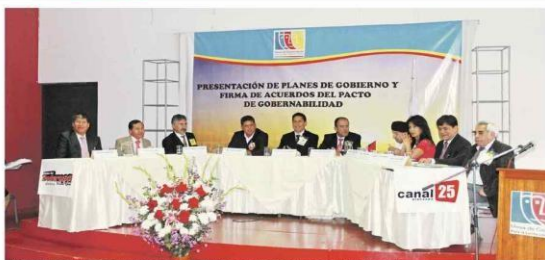
Candidatos compartieron mesa, donde expusieron sus propuestas en distintos ejes

ECONOMÍA. En este aspecto, cada uno de los candidatos presentaron propuestas diferentes pero con un mismo fin que es de mejorar la economía de la población. "Ayacucho, rodeado de grandes riquezas aún no disfruta de sus bondades", señalaron. Y una de las alternativas es de solicitar al gobierno central la