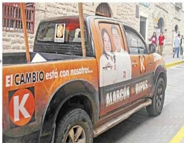
Vehículos coloridos invadieron calles de Huamanga y ciudades al interior de la región

Critican utilización de personas en mítines, ya que son trasladadas bajo diversos engaños