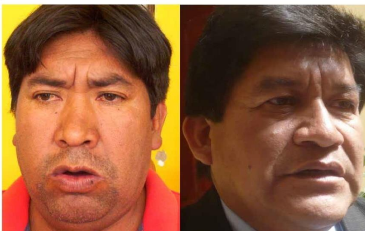
>Candidatos de la ARA en el ojo de la tormenta.