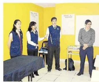
Personal administrativo y de capacitación

TÉCNICO. MARCADO CON ASPA SERÁ INDEPENDIENTE PARA REGIÓN, PROVINCIAL Y DISTRITAL