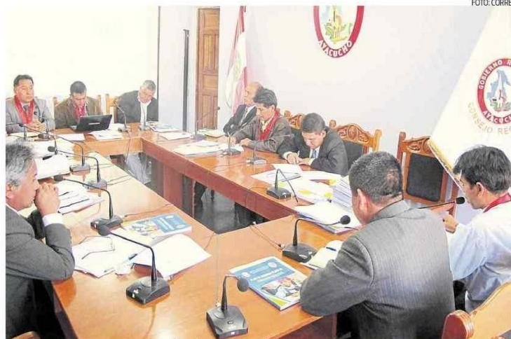
Mayoría de consejeros se mostró oficialista pese a ser de otras tiendas