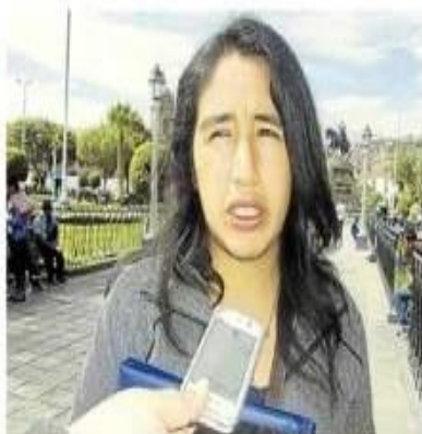
Dirigente criticó el accionar de los candidatos

INDIFERENTES. Pese a que todos los candidatos se jactan de haber respetado la cuota de género y joven, parece que el tema no les interesa, por ello es que no asistieron al conversatorio organizado por la Organización de Mujeres Jóvenes Wiñay Warmi, con la