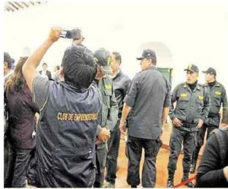
Policia impidió un adecuado trabajo de la prensa