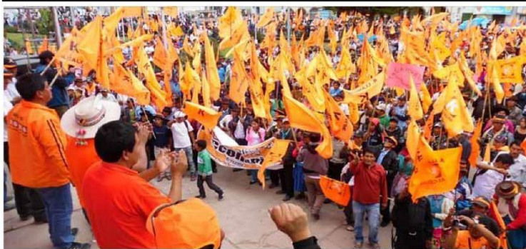
CANDIDATO AL GOBIERNO REGIONAL POR FUERZA POPULAR CERRÓ CAMPAÑA

Pasamos entonces de la confrontación necesaria y natural de propuestas en los procesos electorales, se pasó al debate doméstico sobre si la tacha procedía o no. El resultado fue que ningún tema importante para el futuro de la región haya sido abordado en su plenitud.