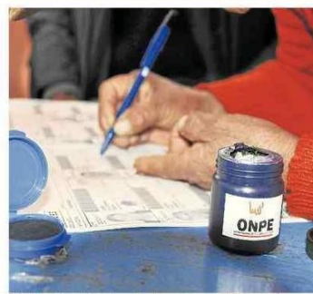
Población deberá participar democráticamente