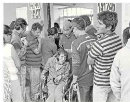
Discapacitados tuvieron facilidades para sufragar