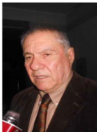
> Minimizó opinión de Donayre

"El señor Donayre ha reconocido que hubo excesos en el tiempo de la violencia política. Él debe saber quienes son los autores de esos excesos; tal como dice que coordinaba con los terroristas o exterroristas, está enterado quienes son los que han cometido esos actos de violación de derechos humanos, tanto del bando de