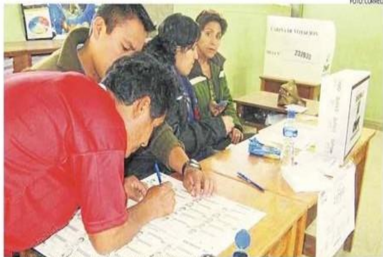
Electorado tendrá oportunidad de analizar a los candidatos

tos deben respetar, declarando con veracidad la información requerida en los formatos del Jurado Nacional de Elecciones, así como de la publicación de los planes de gobierno a fin de fomentar un voto informado. Asimismo, el documento compromete a los candidatos a participar en los debates electorales organizados por el JEE, en los cuales existe el compromiso de garantizar el respeto recíproco entre candidatos y organizaciones