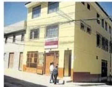
JEE-Huamanga iniciará con evaluación a postulantes

que harían si llegan a ser autoridades", declaró. Cabe precisar, que de ser excluidos, los candidatos no podrán apelar o subsanar su situación, porque hace varios meses se venció el plazo para la presentación de las hojas de vida. "Que quede claro, que luego de ser separados de los comicios, a través de un informe de evaluación a sus hojas de vida, no podrán rea-