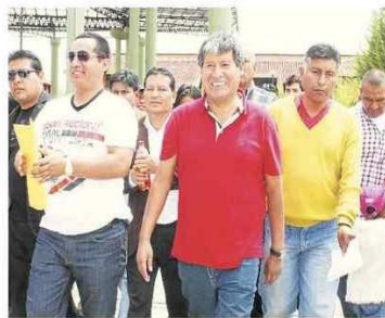
Oscorima espera conquistar a Consejo Regional