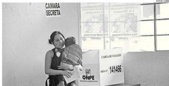
Madres de familia cumplieron con deber ciudadano en locales de votación