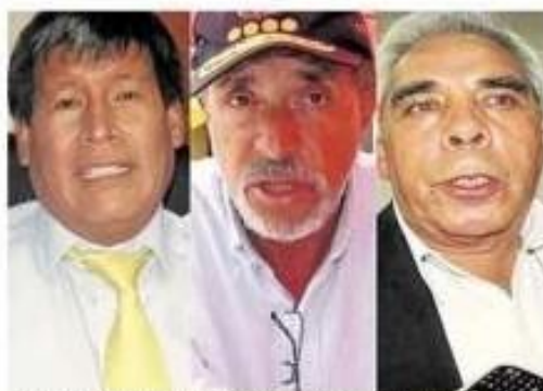
Exautoridad dio su punto de vista sobre aspirantes

pero es un candidato con valores que rechaza la corrupción, quizá su única debilidad sea no tener experiencia en gestión pública.