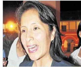
Aprista incómoda por lenguaje poco inclusivo

RETOS. POSTULANTES A LA PRESIDENCIA DEL GOBIERNO REGIONAL FIRMAN DIVERSOS COMPROMISOS