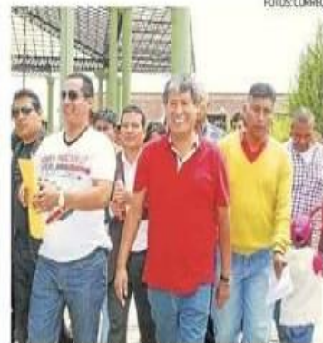
Oscorima confiado desde primer momento