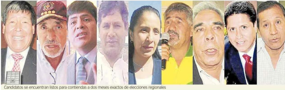
Candidatos se encuentran listos para contiendas a dos meses exactos de elecciones regionales

➤ ADMITIDOS. LISTA DE CANDIDATOS EN TRAMO FINAL LUEGO DE PROCESO DE TACHAS