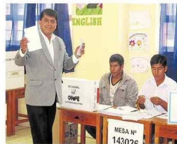
Rúa dio la sorpresa ubicando tres consejeros

DIVIDIDOS. APP PONDRÁ 5 CONSEJEROS, 4 EL ARA, 3 MUSUQ ÑAN Y 2 EL CHOCLO