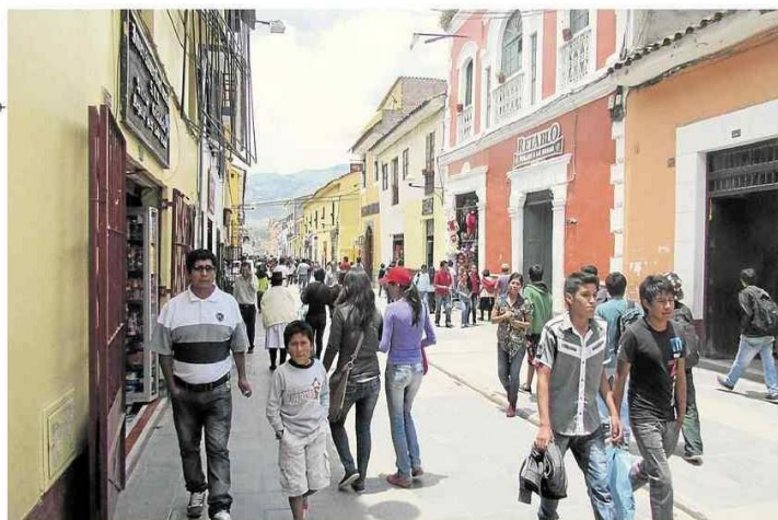
La región de Ayacucho se caracteriza por la presencia de mayor número de mujeres

Elegirán un presidente regional, 11 alcaldes provinciales, 101 alcaldes distritales y 586 regidores