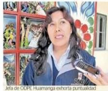
Jefa de ODPE Huamanga exhorta puntualidad

lidad de estas elecciones. La ODPE Huamanga tiene en su circunscripción a 43 distritos de la provincias de Huamanga, Huanta, La Mar y Vilcashuamán, donde el personal se desplegó oportunamente.