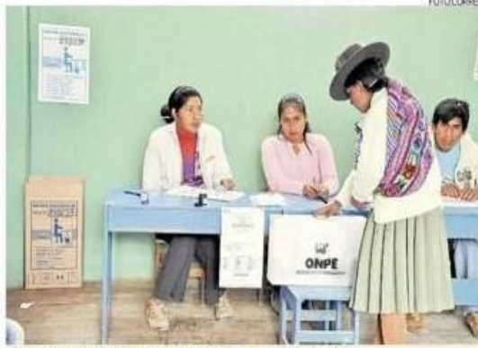
Ayacuchanos elegirán a sus autoridades en toda la región