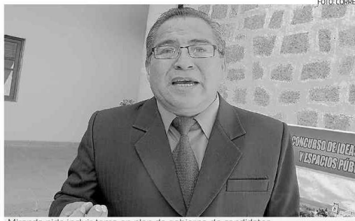
Miranda pide incluir tema en plan de gobierno de candidatos

OLVIDADO. Dijo que a menos de dos meses para desarrollarse las elecciones, actualmente ninguno de los candidatos aún no incorpora este tema en sus planes, pero que es necesario que hayan propuestas concretas para bajar los índices de inseguridad ciudadana y sobre todo de trata contra niñas y jovencitas. "Si bien se está avanzando en la lucha contra la trata de personas porque las denuncias han incrementado y la cantidad de presos sentenciados por