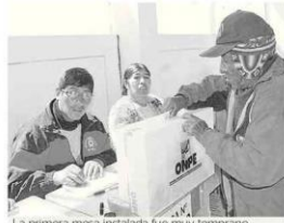
La primera mesa instalada fue muy temprana

4 PM Fue el cierre de los locales de votación en toda la región, por medidas de seguridad para cumplir con el conteo