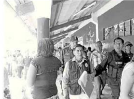
Detienen a persona por inducir a votar por árbol