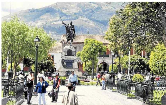
Población debe enterarse más sobre los candidatos para elegir bien a sus autoridades