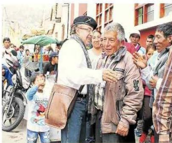
Donayre tendrá mayoría de consejeros