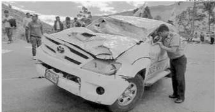
Sistema de seguridad del vehículo permitió que el accidente no cobre víctimas.

LABOR. El candidato en campaña se dirigía junto con su comitiva a la provincia de Lucanas para