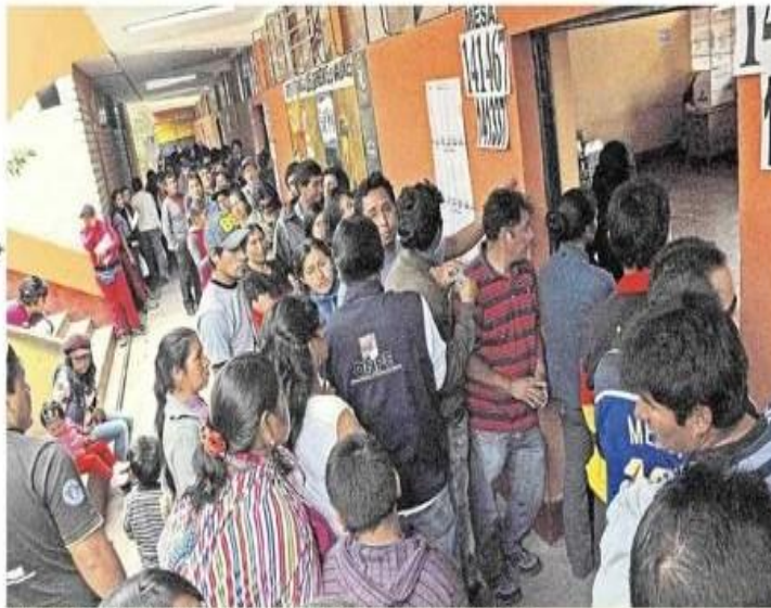
Voluntad popular estuvo disputada voto a voto entre Oscorima y Donayre

Distritos más alejados retardaron resultados de elecciones regionales y municipales