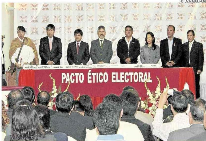
Los postulantes vivieron una fiesta llena de compromisos que deberán cumplir en estas elecciones

ASISTENTES. Entre los partidos y movimientos presentes en la ceremonia de la suscripción del Pacto Ético Electoral estuvieron el candidato por Alianza