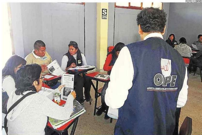
Días de capacitación al personal fue arduo según los propios capacitadores

ACCIONES. Además informó que se concluyó con la capacitación de coordinadores distritales y coordinadores de centros poblados que se desplazarán hacia las zonas asignadas a fin de hacer la verificación de las rutas, los locales de votación y otros indicadores necesarios para una adecuada planificación de las elecciones. "Se concluyó con la segunda etapa de capacitación que ahora fue con estos coordinadores y debemos recabar la información sobre la situación de los locales de votación, las vías de comunicación, entre otros aspectos que se exigen en