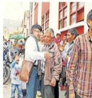
Donayre espera últimos resultados