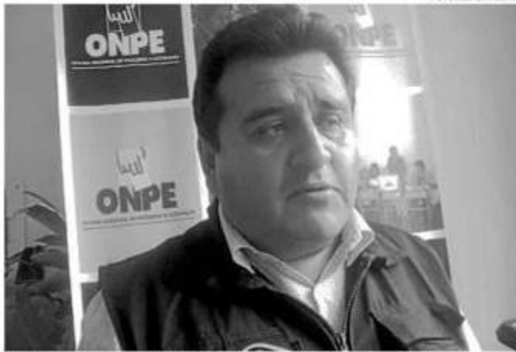
Jefe de la Onpe Ayacucho exhorta al juego limpio en las elecciones

Dio a conocer, que los motivos por los cuales pueden presentarse tacha contra un miembro de mesa es por pertenecer a la Policía Nacional del Perú o a las Fuerzas Armadas, así como por trabajar en alguna entidad del sistema electoral o por mantener relación en segundo grado de afinidad con otro miembro de mesa o con algún candida-