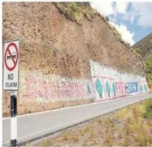
Organizaciones políticas colocan indiscriminadamente propaganda en cerros

Dentro del grupo de instituciones públicas está el Gobierno Regional de Ayacucho, con 44 incidencias, las cuales está siguiendo un proceso de investigación, tras haber incurrido en omitir dar cuenta de la difusión de publicidad estatal en cual-