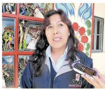
Jefa de ODPE Huamanga informa acciones