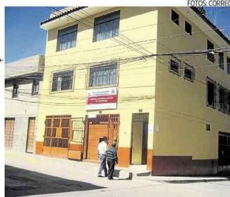
JEE Huamanga continuará con evaluaciones

Los postulantes a cargos de consejeros, alcaldes y regidores no informaron situación en hojas de vida