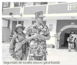
Seguridad de locales estuvo garantizada