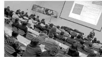
Docentes participarán en evento vía internet

Al respecto, manifestó que tiene experiencia y capacidad de gestión en la administración pública y se comprometió a que en caso de ganar las contiendas del cinco de octubre, buscará el desarrollo de su distrito. "En la regiduría de la Municipalidad de Huamanga he aprendido de gestión", refirió el candidato.