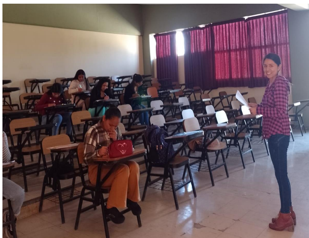
Investigadora aplicando instrumentos de investigación