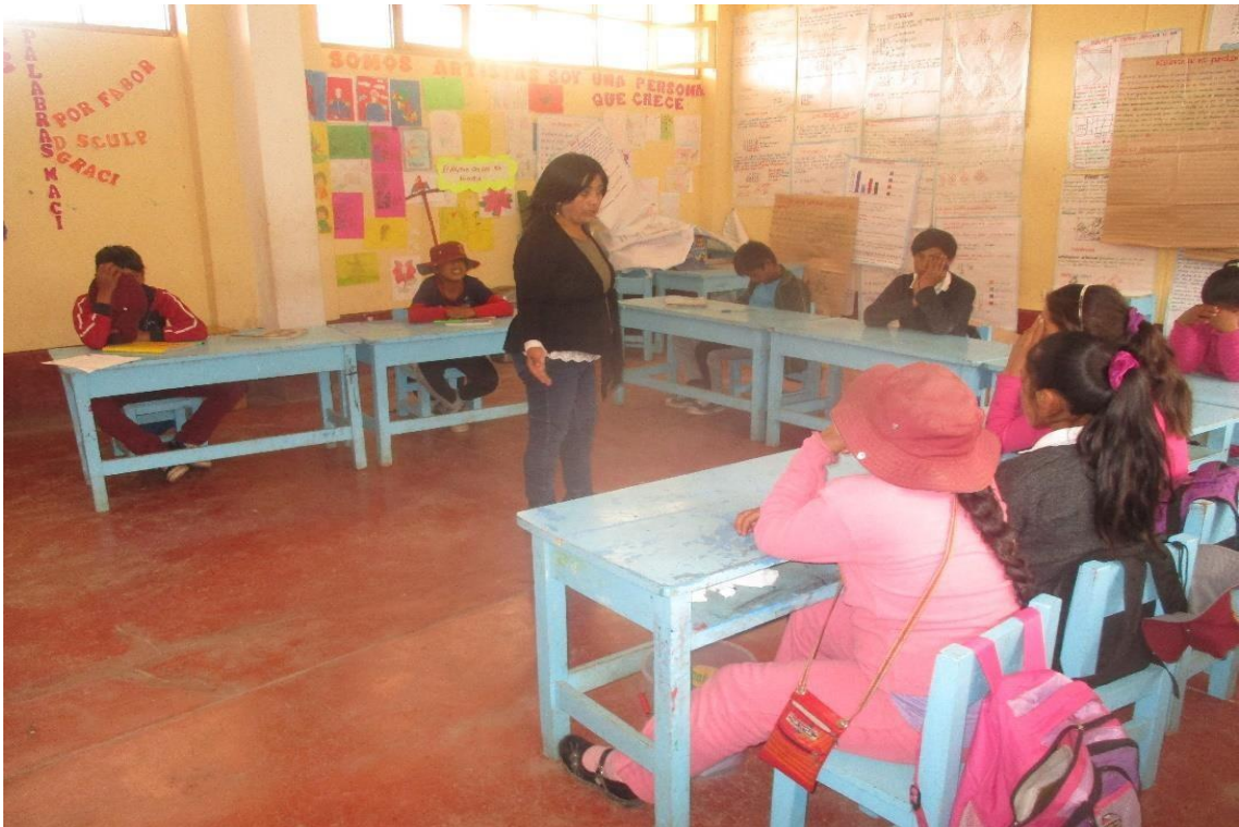
Participación de los alumnos de la I.E “Julio C. Tello” en el taller “conociendo mis derechos “