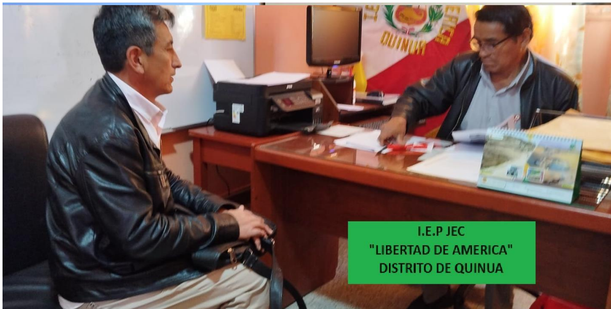
I.E.P JEC "LIBERTAD DE AMERICA" DISTRITO DE QUINUA