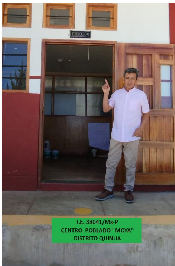
I.E. 38041/Mx-P CENTRO POBLADO "MOYA" DISTRITO QUINUA