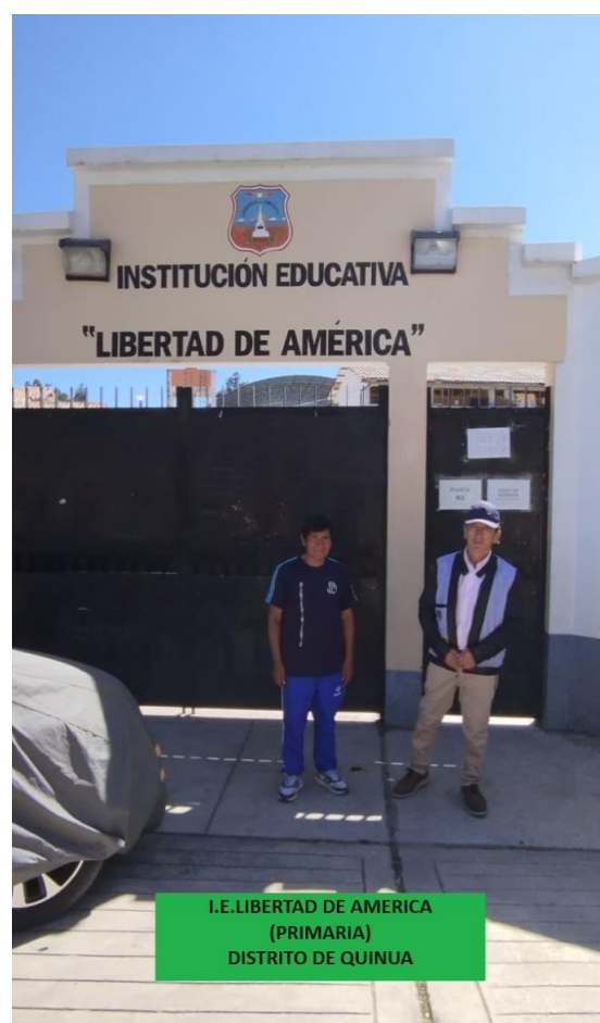
I.E. LIBERTAD DE AMERICA (PRIMARIA) DISTRITO DE QUINUA