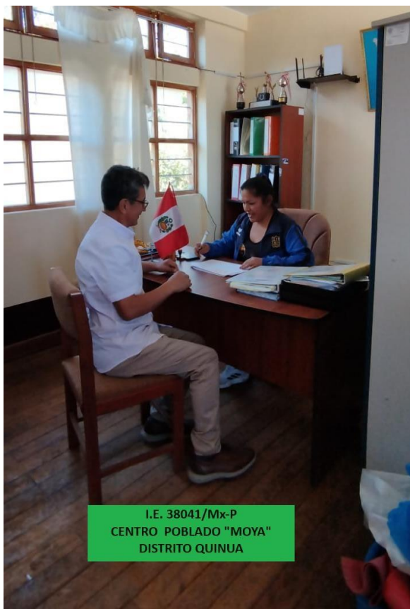
I.E. 38041/Mx-P CENTRO POBLADO "MOYA" DISTRITO QUINUA