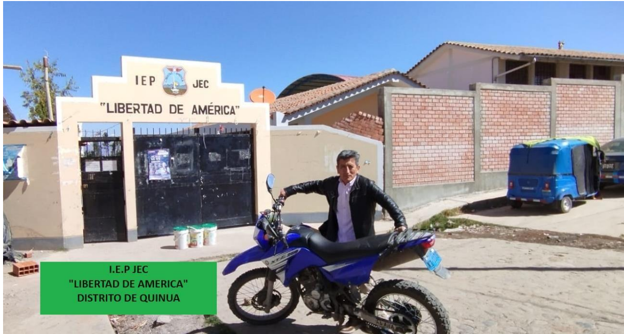
I.E.P JEC "LIBERTAD DE AMERICA" DISTRITO DE QUINUA