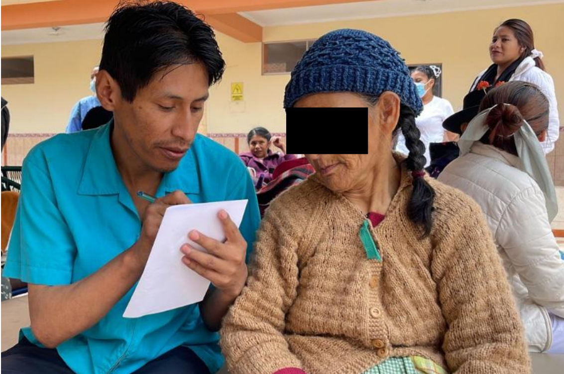
Aplicando entrevista estructurada a adulta mayor en Hogar de ancianos "Padre Saturnino"