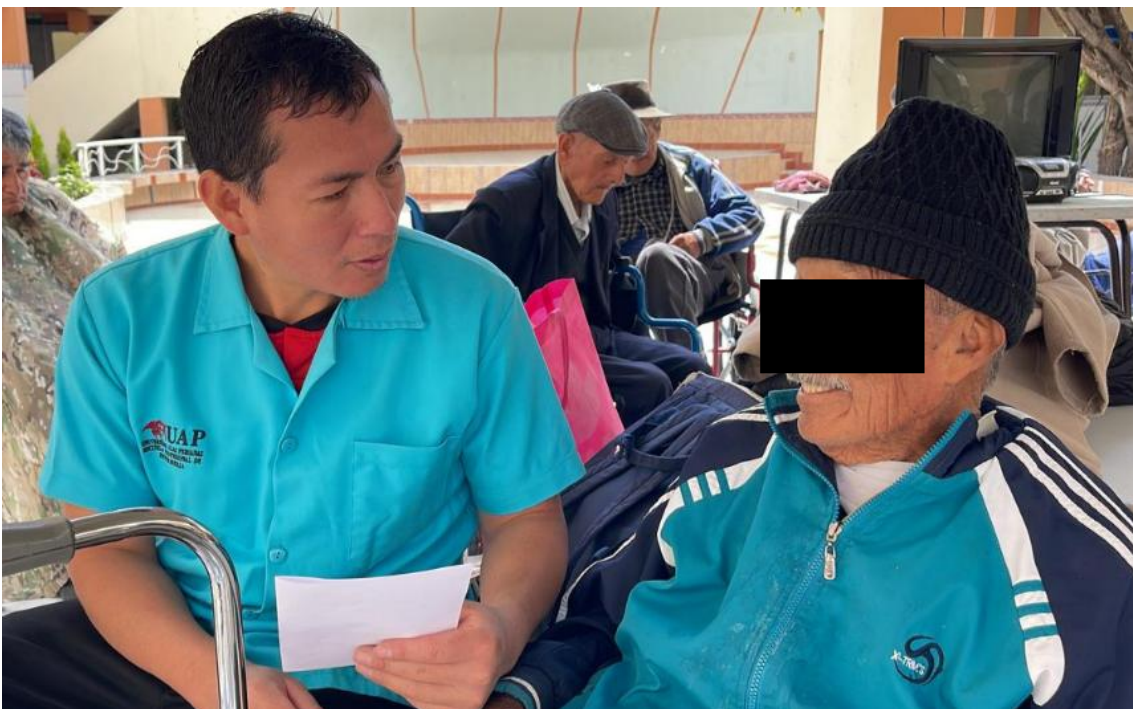
Aplicando entrevista estructurada a adulto mayor en Hogar de ancianos "Padre Saturnino"