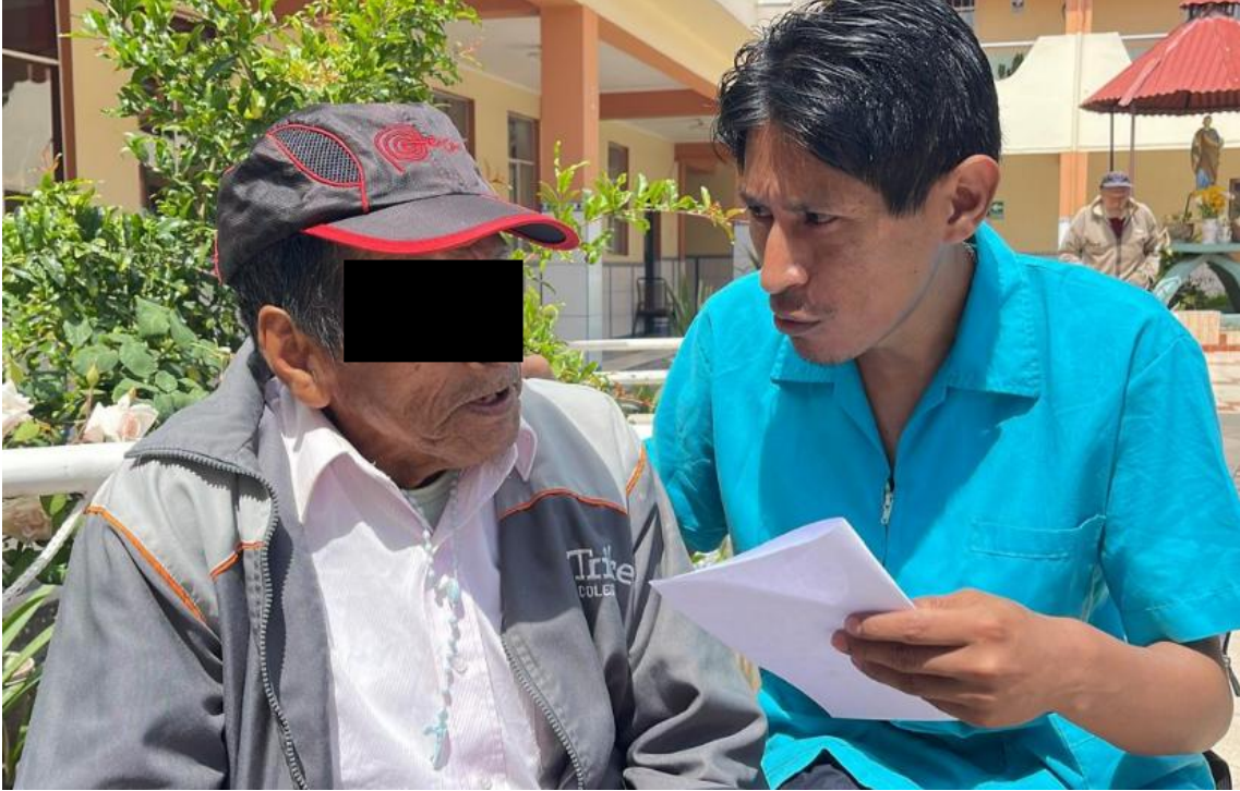
Aplicando entrevista estructurada a adulto mayor en Hogar de ancianos "Padre Saturnino"