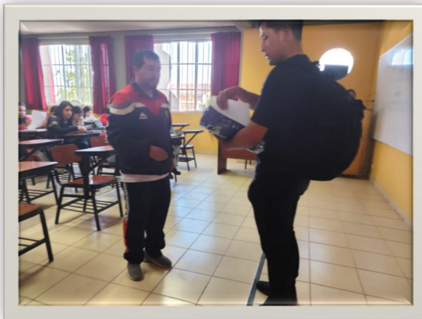
Imagen 6. Explicando a los estudiantes de la serie 200 de la escuela profesional de educación secundaria como deben llenar las encuestas.