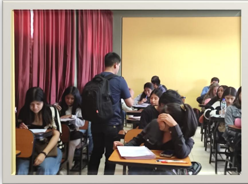
Imagen 8. Distribución de las encuestas a los estudiantes de la seria 100 de la escuela profesional de educación secundaria.