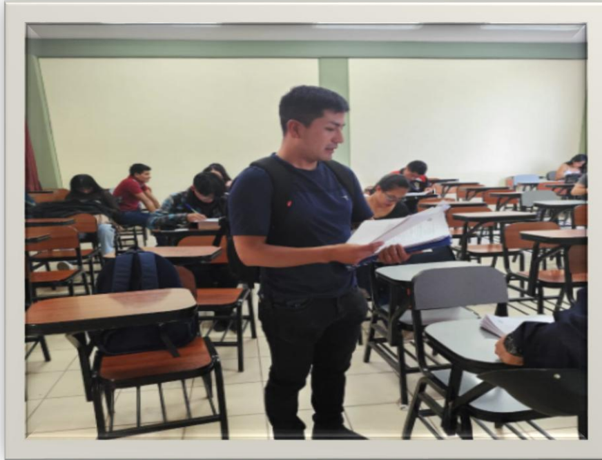
Imagen 4. Distribuyendo las encuestas a los estudiantes de la serie 300 de la escuela profesional de educación secundaria para su llenado.