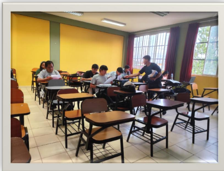
Imagen 2. Orientando a los estudiantes de la serie 500 de la escuela profesional de educación secundaria para el llenado de las encuestas.

Imagen 1. Distribuyendo las encuestas a los alumnos de la serie 500 de la escuela profesional de educación secundaria.