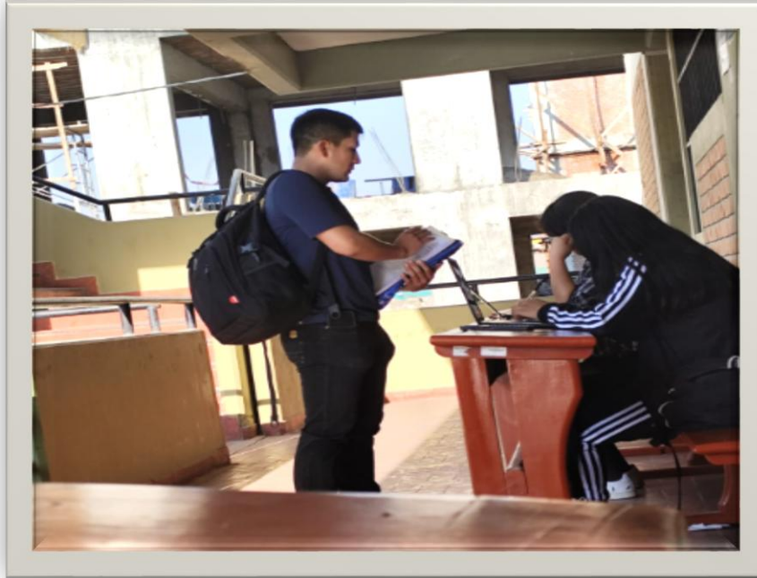
Imagen 10. Llenado de las encuestas con los estudiantes de la escuela profesional de educación secundaria que se encontraban en los pasillos.