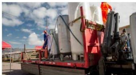
> Entrega de planta de oxígeno en la provincia de Cangallo.

descentralizados, por ello la adquisición de las tres plantas de oxígeno medicinal estarán localizadas en puntos estratégicos de la región que beneficiará a las 11 provincias. "La planta de oxígeno medicinal no trabajará