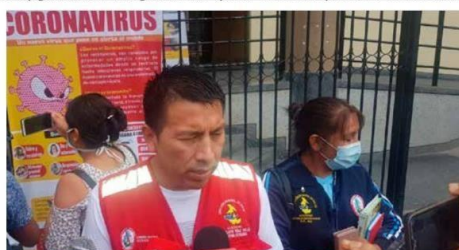
Director de la Diresa informó sobre el caso

le hizo al paciente es desde el 24 de marzo, fecha en donde presentó los síntomas; de acuerdo a la información del sec-