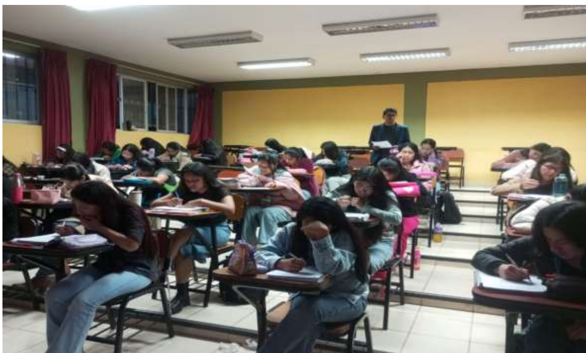
Fotografía 4: Estudiantes concentrados respondiendo el cuestionario.