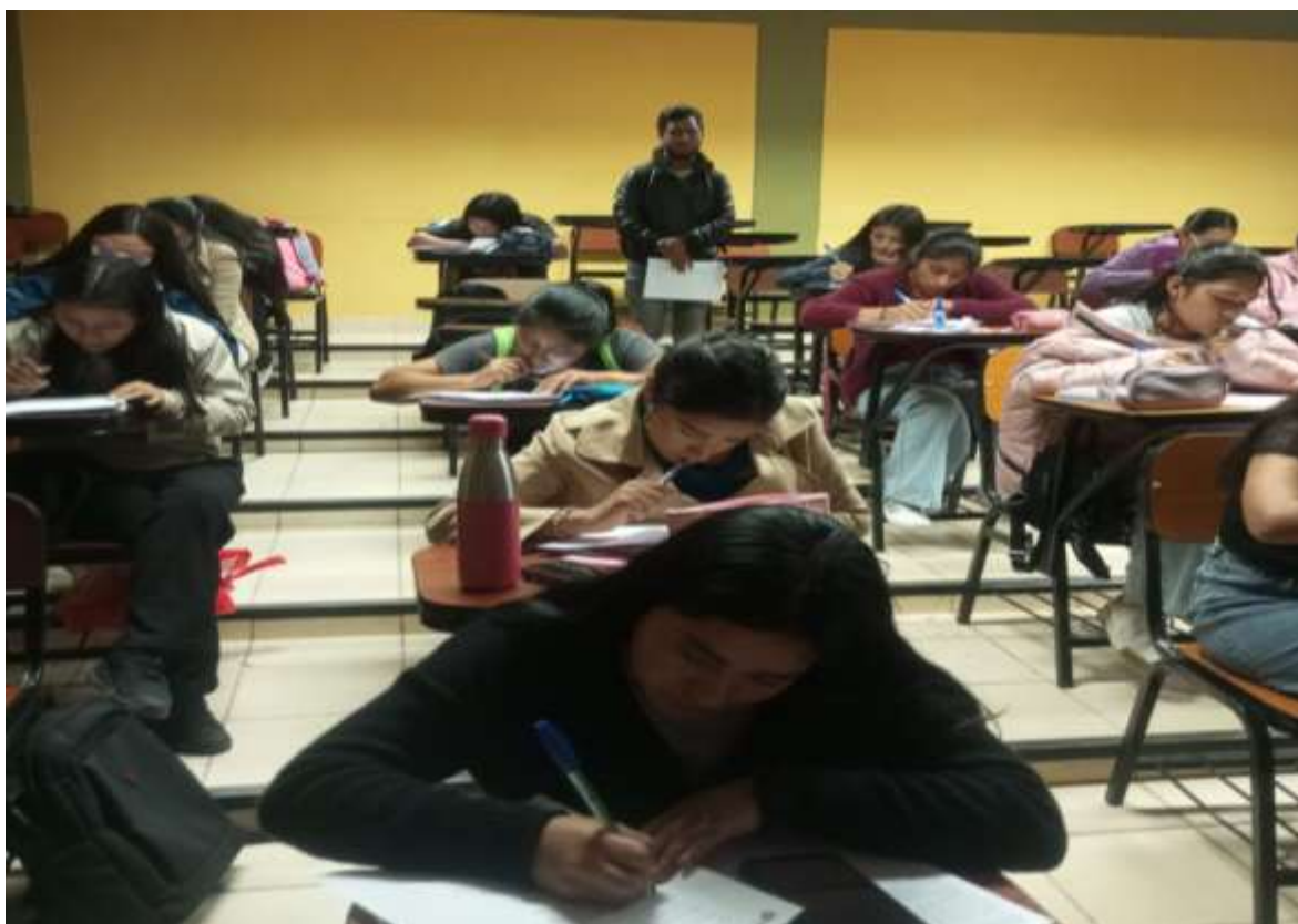
Fotografía 3: Aplicando el cuestionario a los estudiantes de la EP de Educación Inicial.