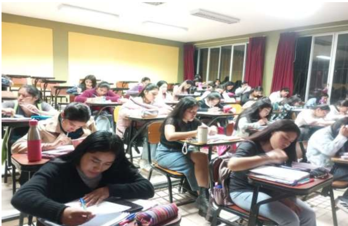
Fotografía 1: Estudiantes de la serie 100 de la EP de Educación Inicial respondiendo el cuestionario.