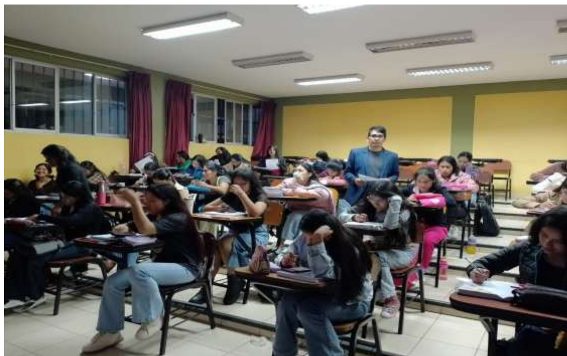
Fotografía 2: Supervisión del cuestionario de los estudiantes universitarios.