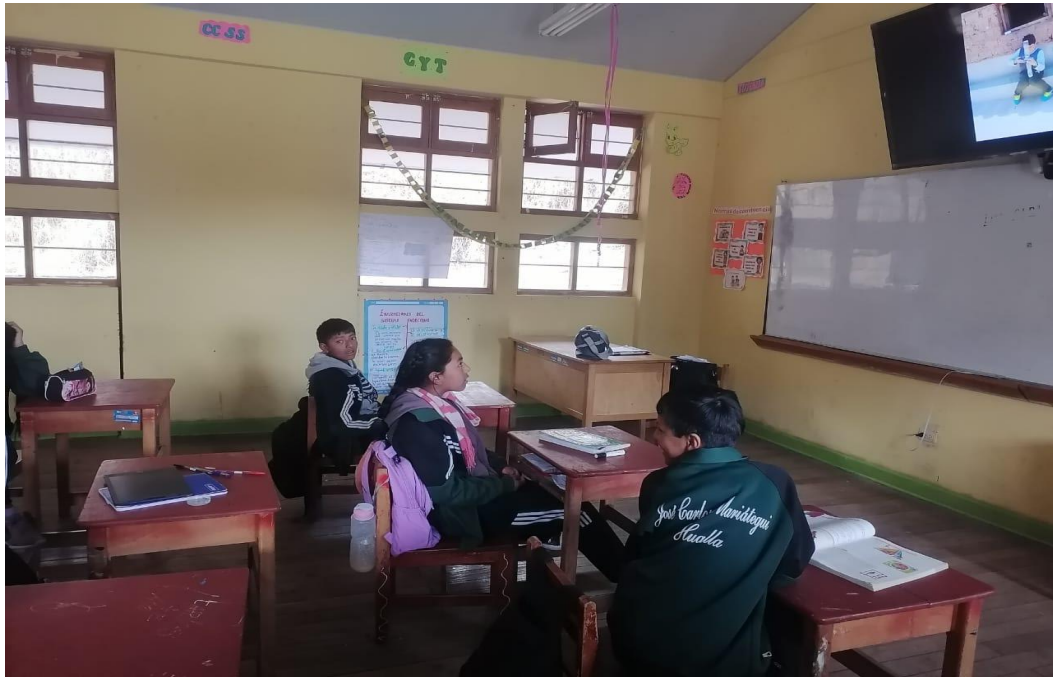
Imagen 1: observación de los estudiantes de IE “José Carlos Mariátegui de Hualla”