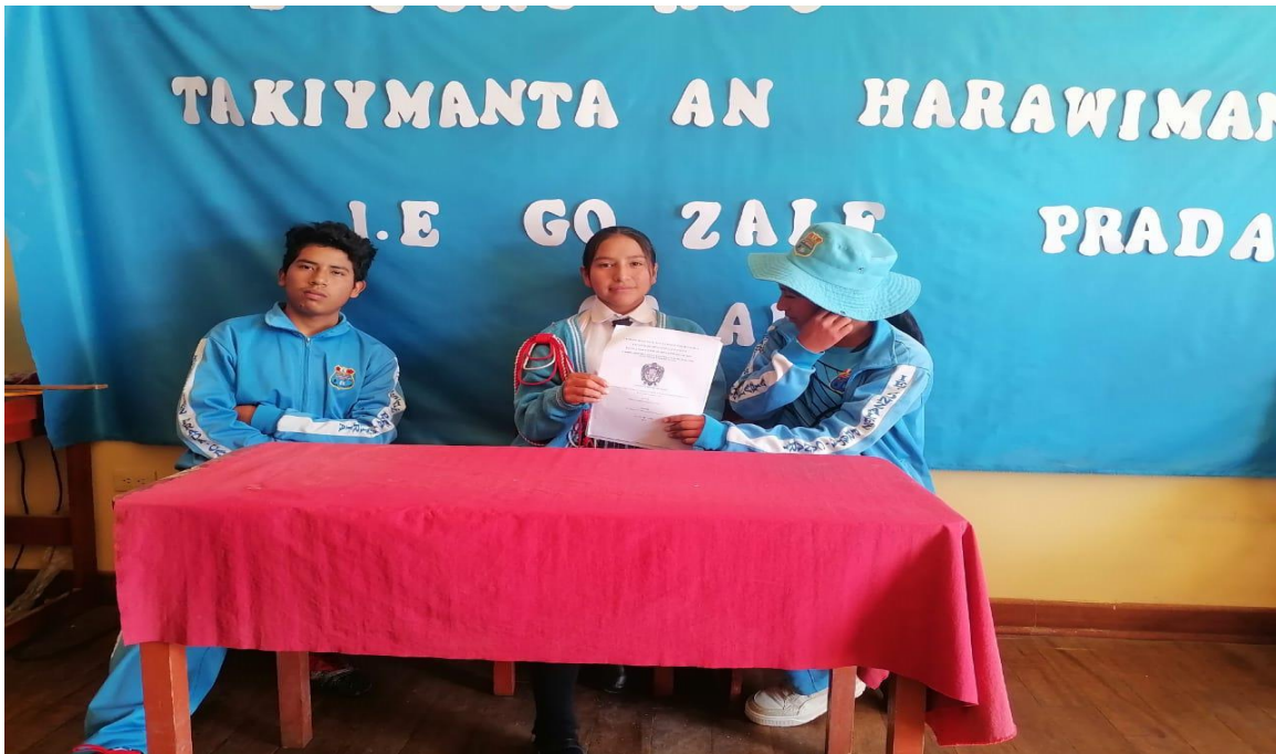
Imagen 3: Grupos focales con los estudiantes de IE “Nuestra señora de Asunción” - Sarhua