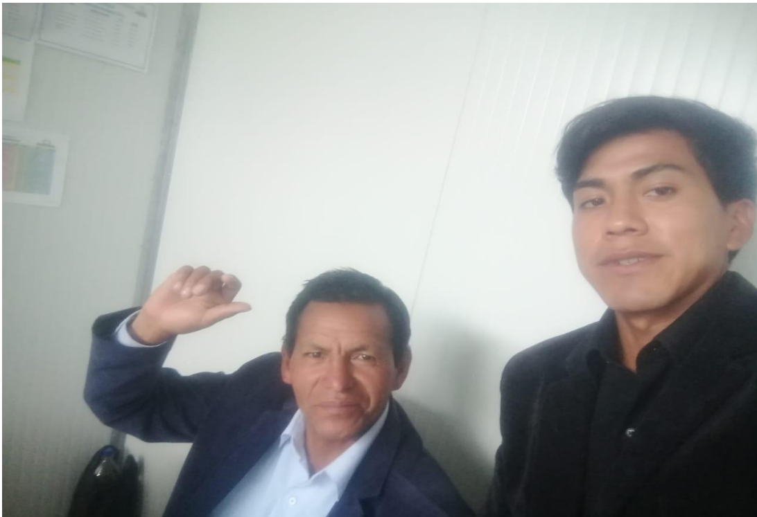
Imagen 5: Entrevista al director de IE “Gonzales Parda de Canaria”