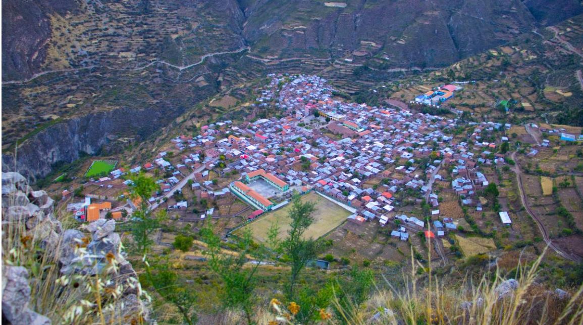
Figura 1: Vista panorámica de la localidad de Sarhua

La figura 1 corresponde a la imagen panorámica de la comunidad campesina de Sarhua, una jurisdicción del distrito del mismo nombre donde se desarrolló la investigación. Esta zona rural se encuentra ubicada en la provincia de Víctor Fajardo en el departamento de Ayacucho. Según el Centro de Recursos Interculturales (CRI, 2025), una comunidad campesina es una forma de organización de las áreas rurales del Perú y la localidad de Sarhua responde a este tipo de organización.