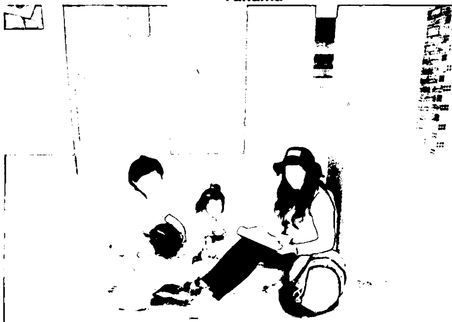
FOTO N° 04 Entrevista a una madre de familia de la Asociación de Vivienda de Yanama