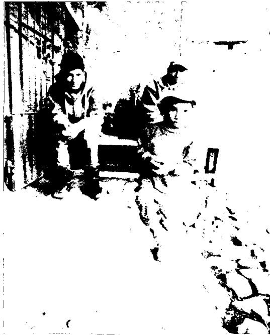
FOTO N° 08 Niño de 03 Años en su Evaluación del Desarrollo Psicomotor, según la motricidad.