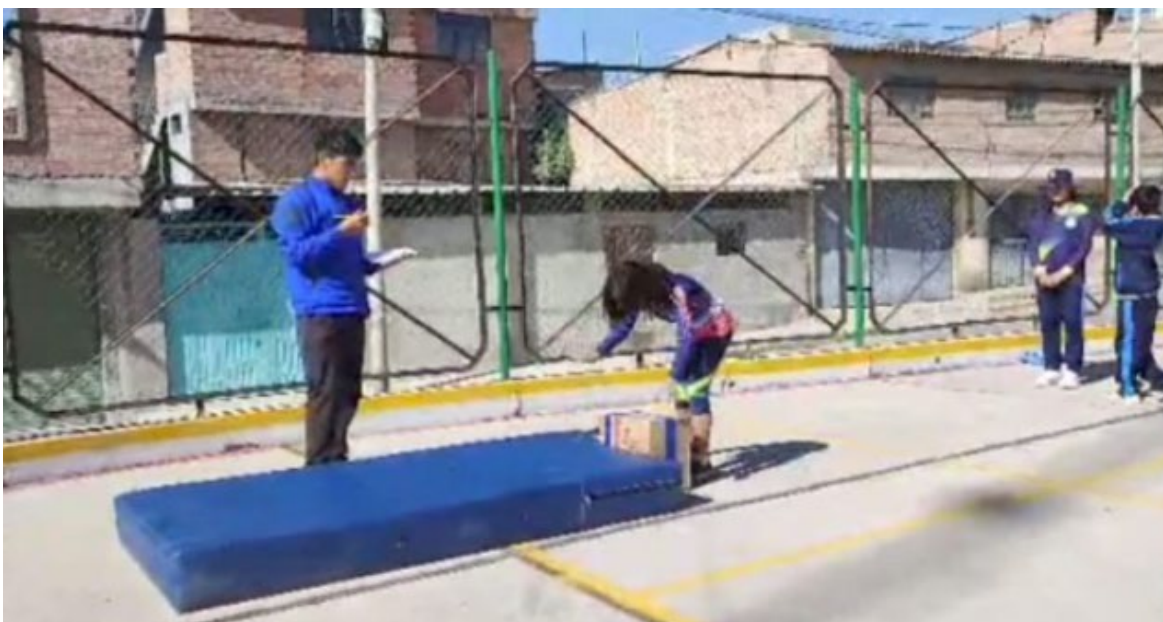
Descripción: Evaluación de las capacidades motrices básicas