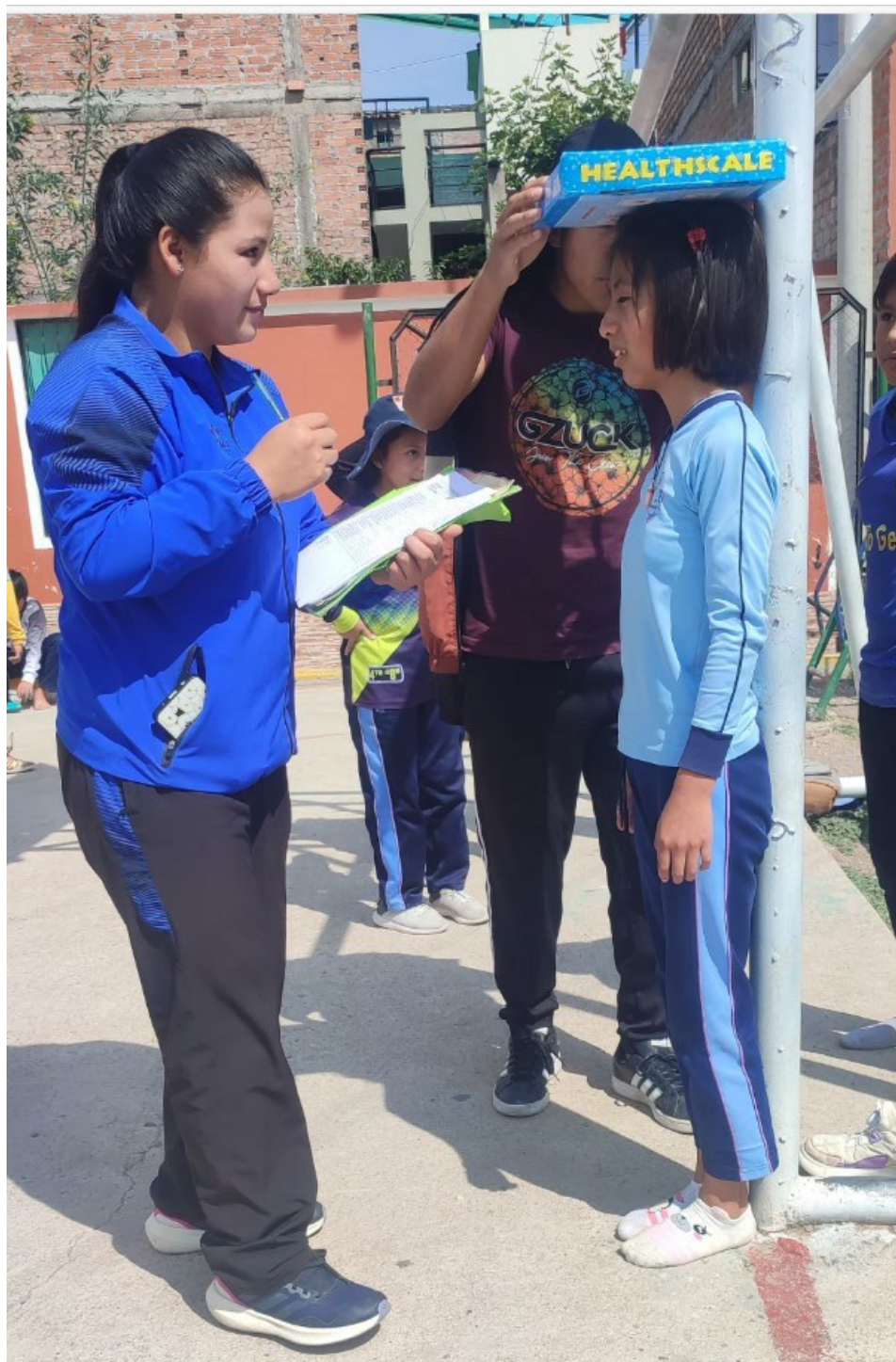
Descripción: Toma de datos antropométricos