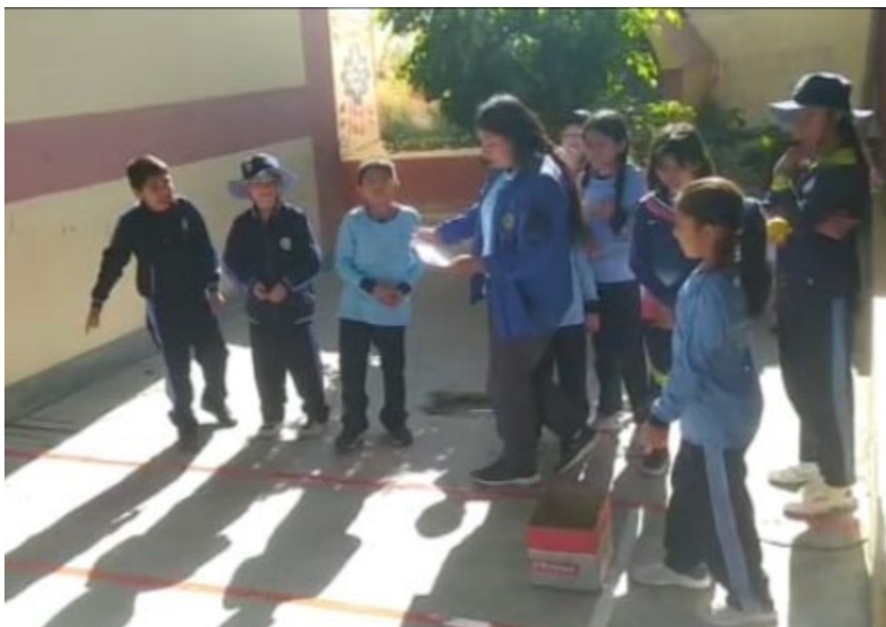
Descripción: Evaluación de las capacidades motrices básicas