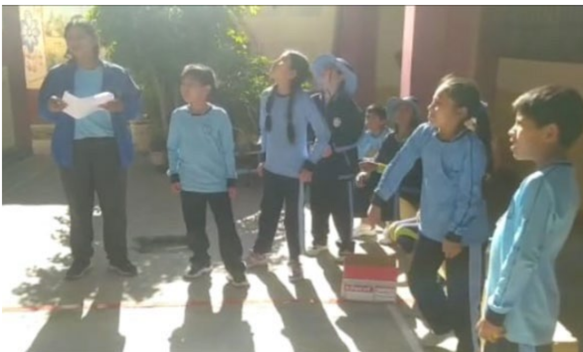
Descripción: Evaluación de las capacidades motrices básicas