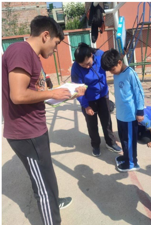
Descripción: Evaluación de las capacidades motrices básicas