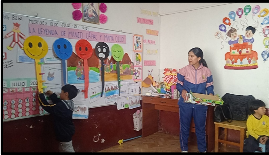
Registro fotográfico 10/11/2023