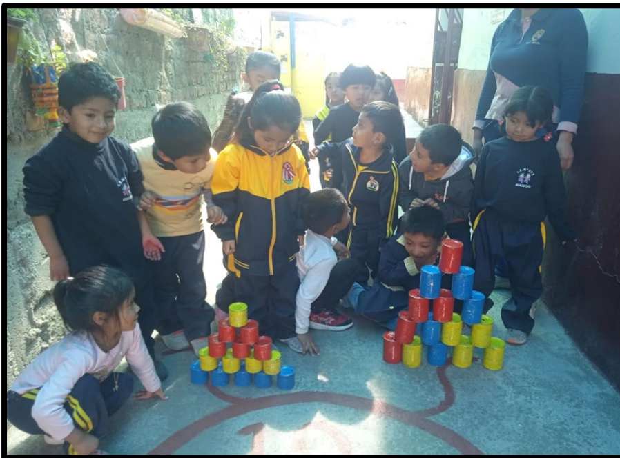
Registro fotográfico 10/11/2023