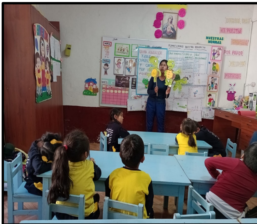
Registro fotográfico 10/11/2023