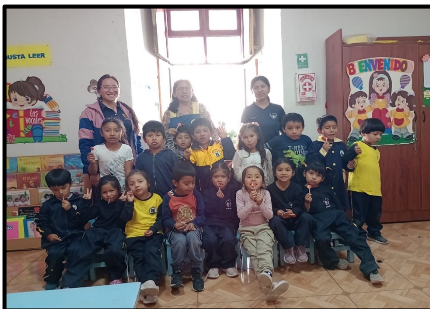
Registro fotográfico 10/11/2023