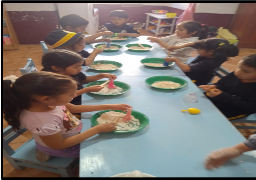
Registro fotográfico 10/11/2023