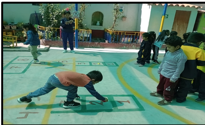
Registro fotográfico 10/11/2023