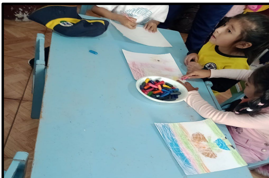
Registro fotográfico 10/11/2023