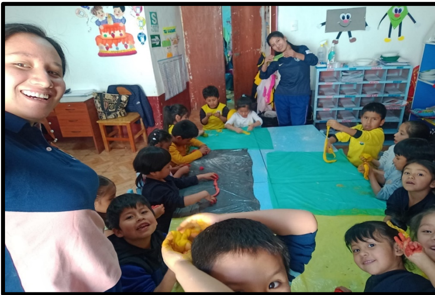
Ilustración 4: Taller de plastilina casera