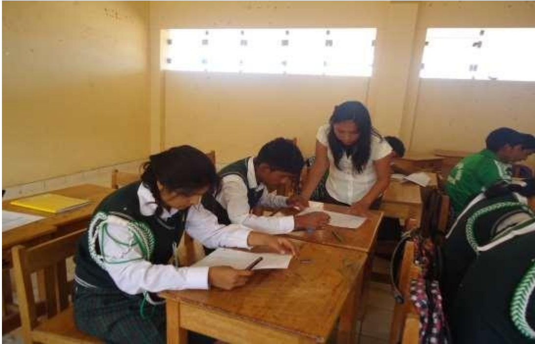
Imagen 1. Estudiantes realizando la estrategia del subrayado.