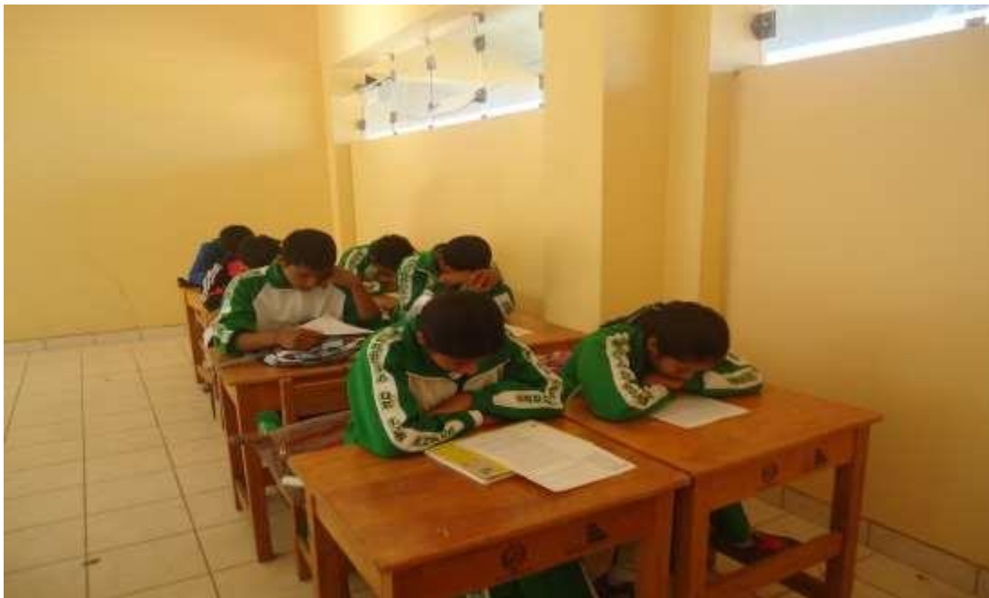
Imagen 2. Aplicando estrategias para la comprensión lectora en textos.