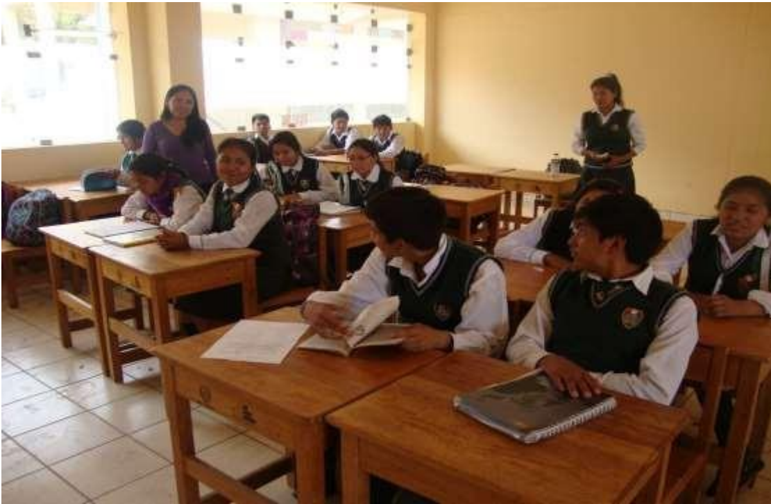
Imagen 3. Aplicación de la estrategia de lectura del parafraseo.