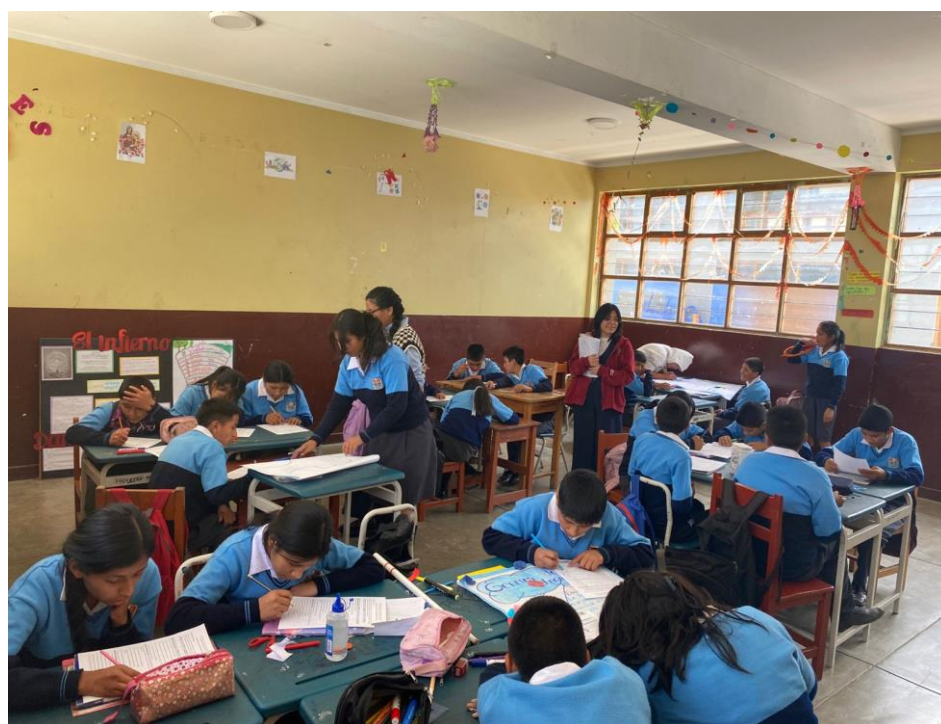
Aula donde se aplicó el cuestionario