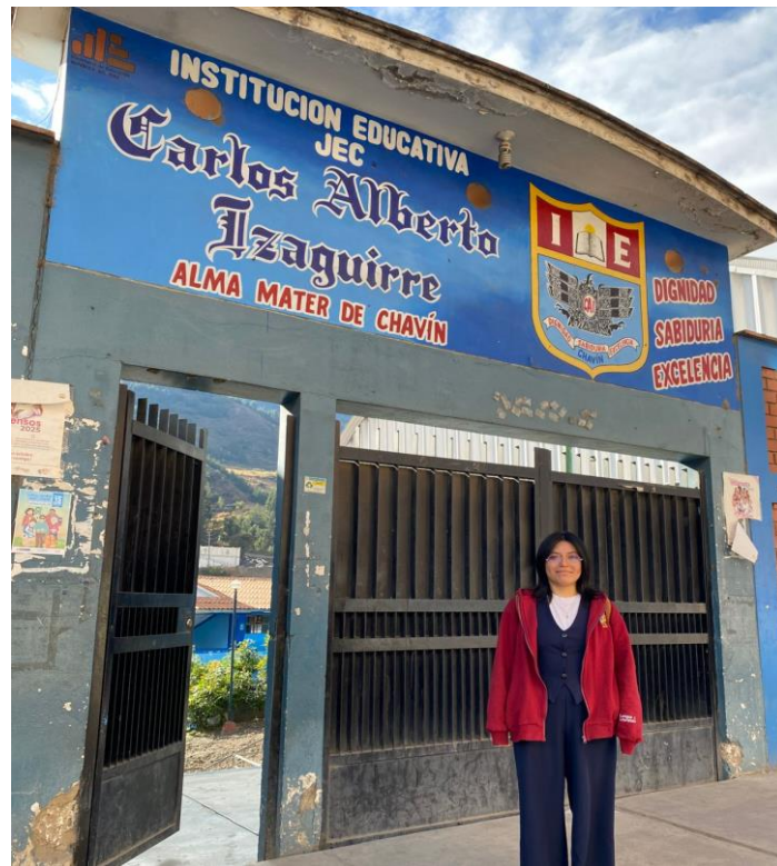
Tesista en la institución de investigación