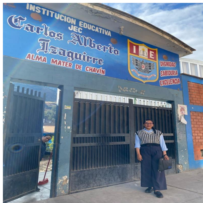
Tesista en la institución de investigación