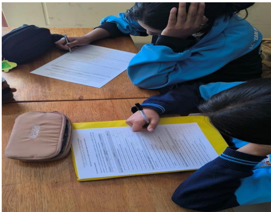
Estudiantes resolviendo el cuestionario