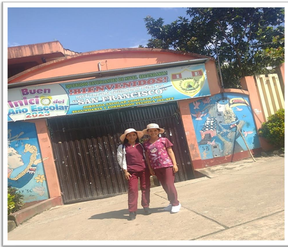
*Llegada y reconocimiento de la institución educativa