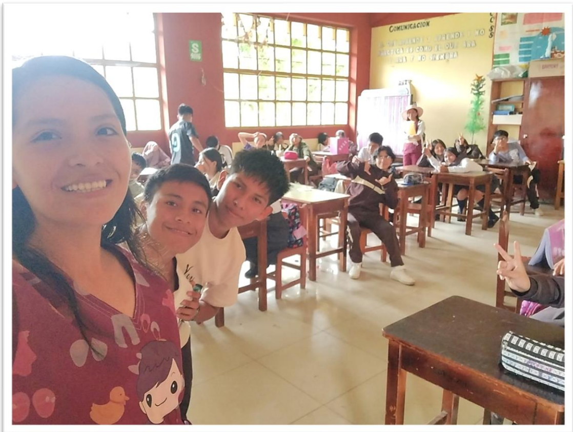
*Después de encuestar, finalizamos con una breve charla educativa