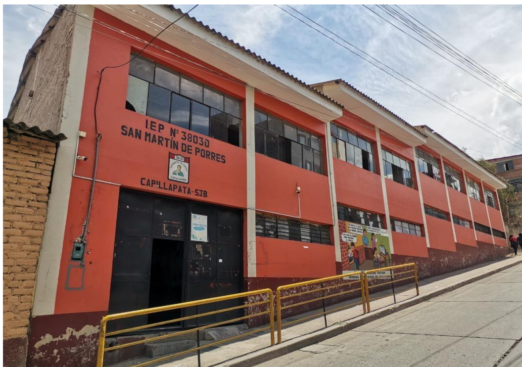
Local de la IE San Martín de Porres, de Capillapata, distrito de San Juan Bautista