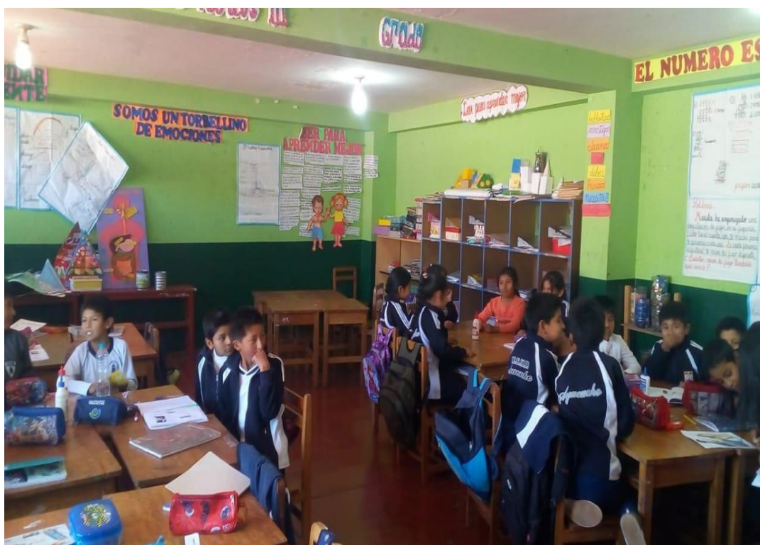
Alumnos de IE San Martín de Porres, de Capillapata, distrito de San Juan Bautista-Ayacucho