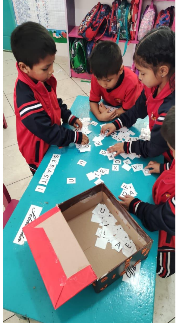
Imagen N°4: Taller “Cajas Mágicas”