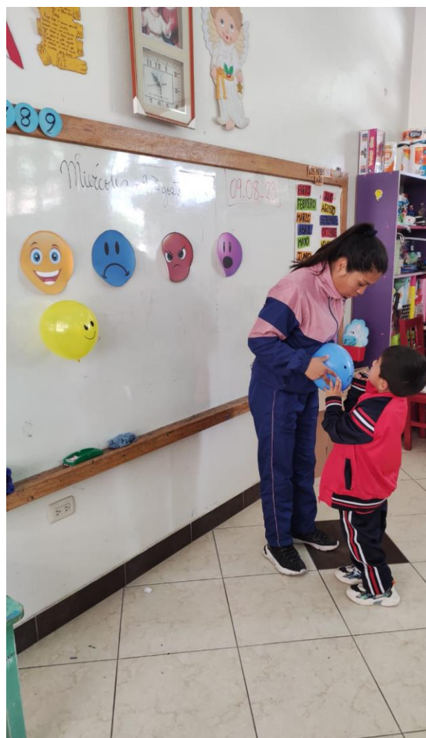
Imagen N°11: Taller “Globos de las emociones”