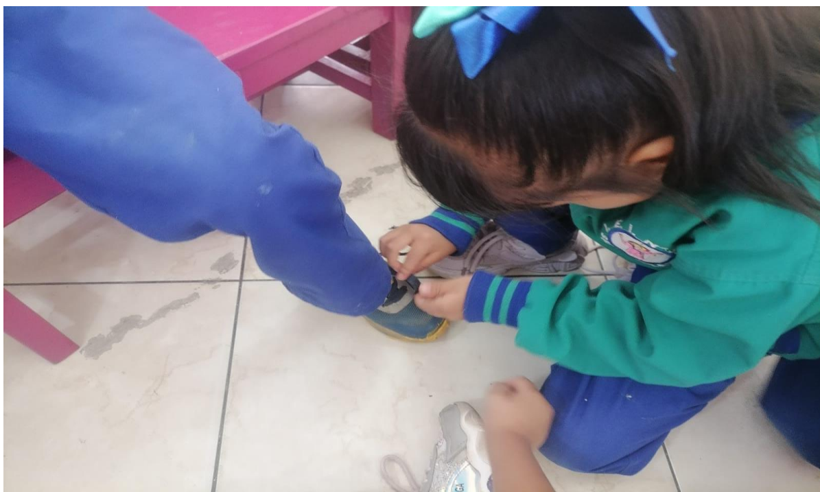
Imagen N°6: Taller “Jugando aprendo a amarrarme los zapatos”