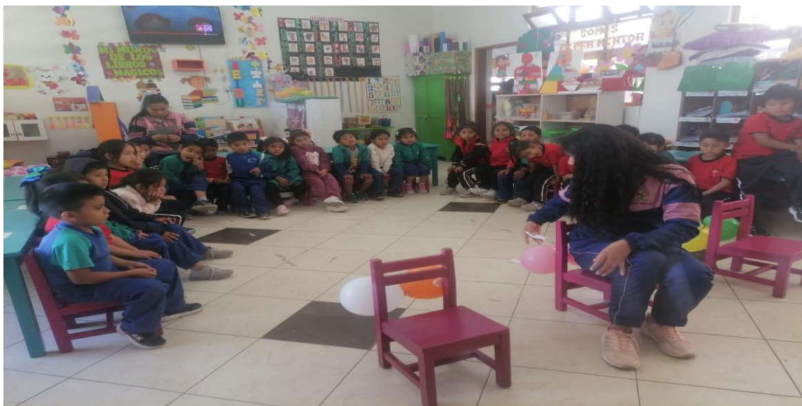
Imagen N°1: Taller “A limpiarse la cola”