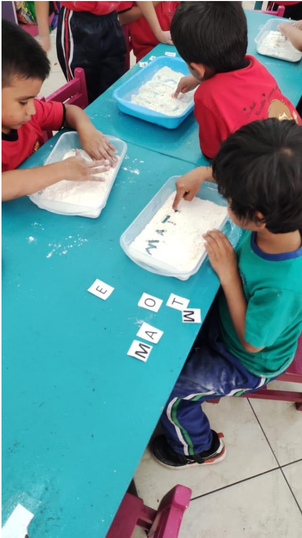
Imagen N°3: Taller “Cajas Mágicas”