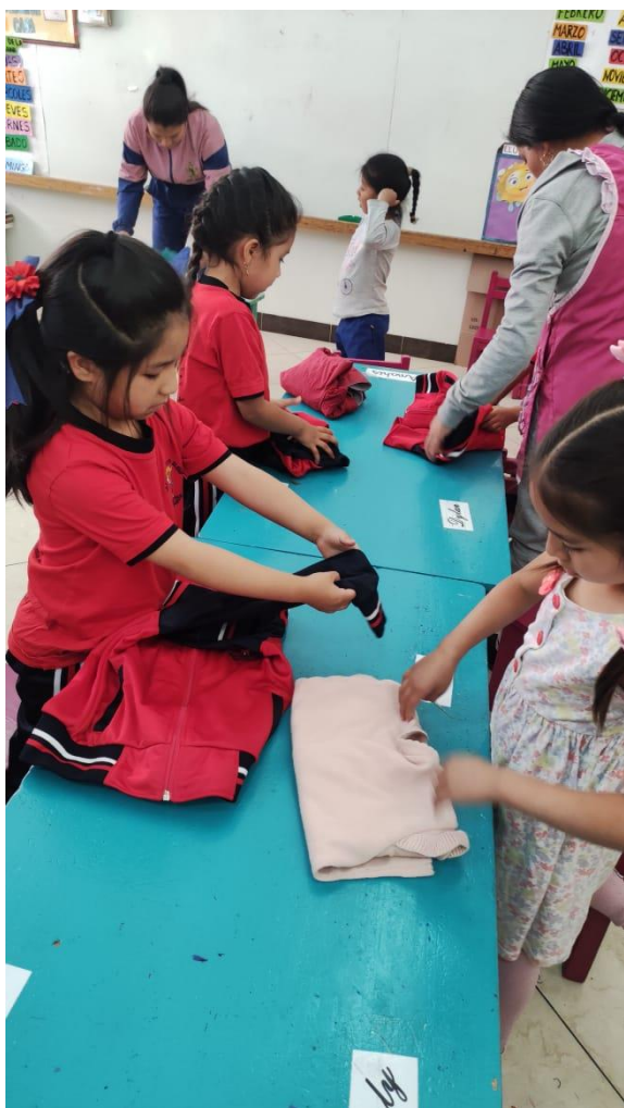
Imagen N°13: Taller “Yo ordeno y doblo mi ropa”