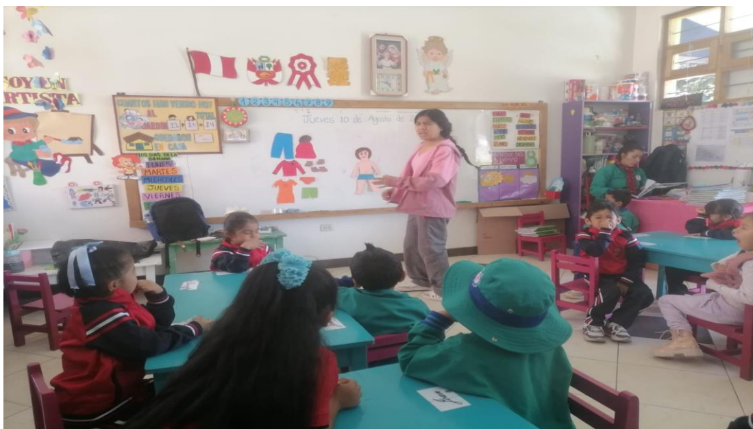
Imagen N°12: Taller “Me divierto vistiendo y desvistiendo”