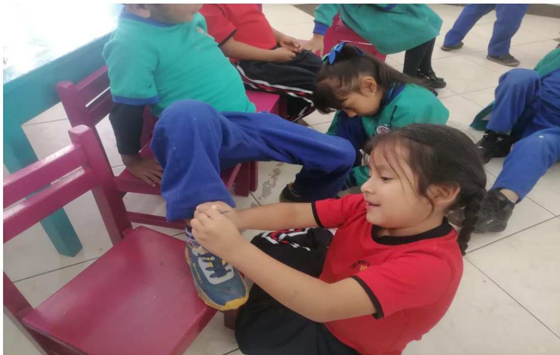
Imagen N°7: Taller “Jugando aprendo a amarrarme los zapatos”