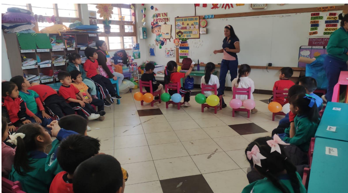
Imagen N°2: Taller “A limpiarse la cola”