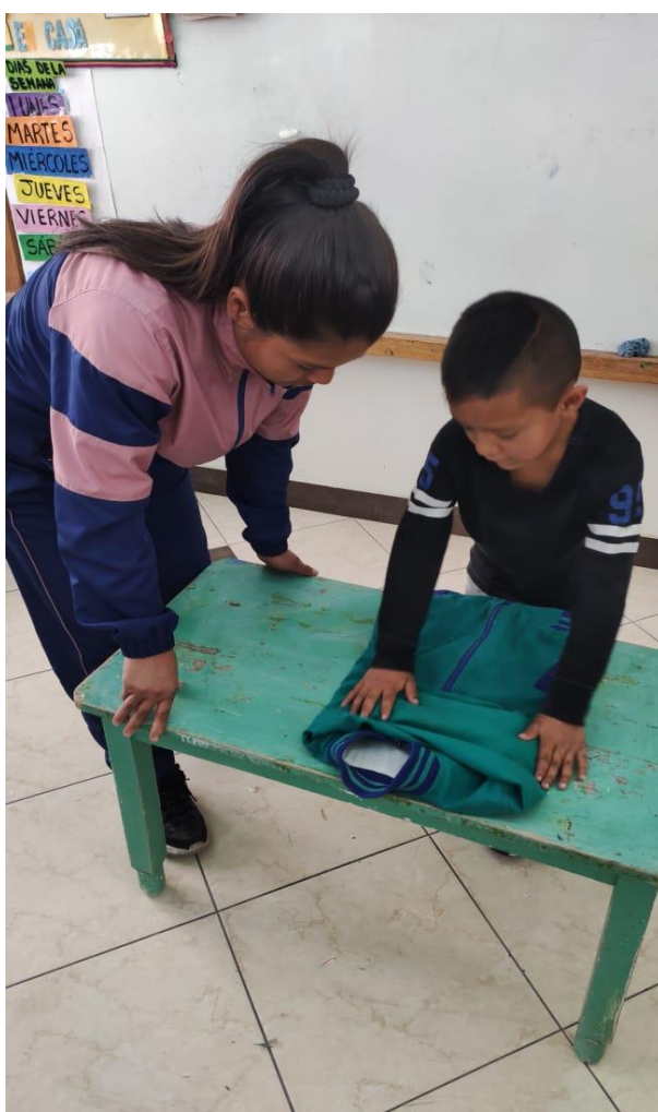
Imagen N°14: Taller “Yo ordeno y doblo mi ropa”