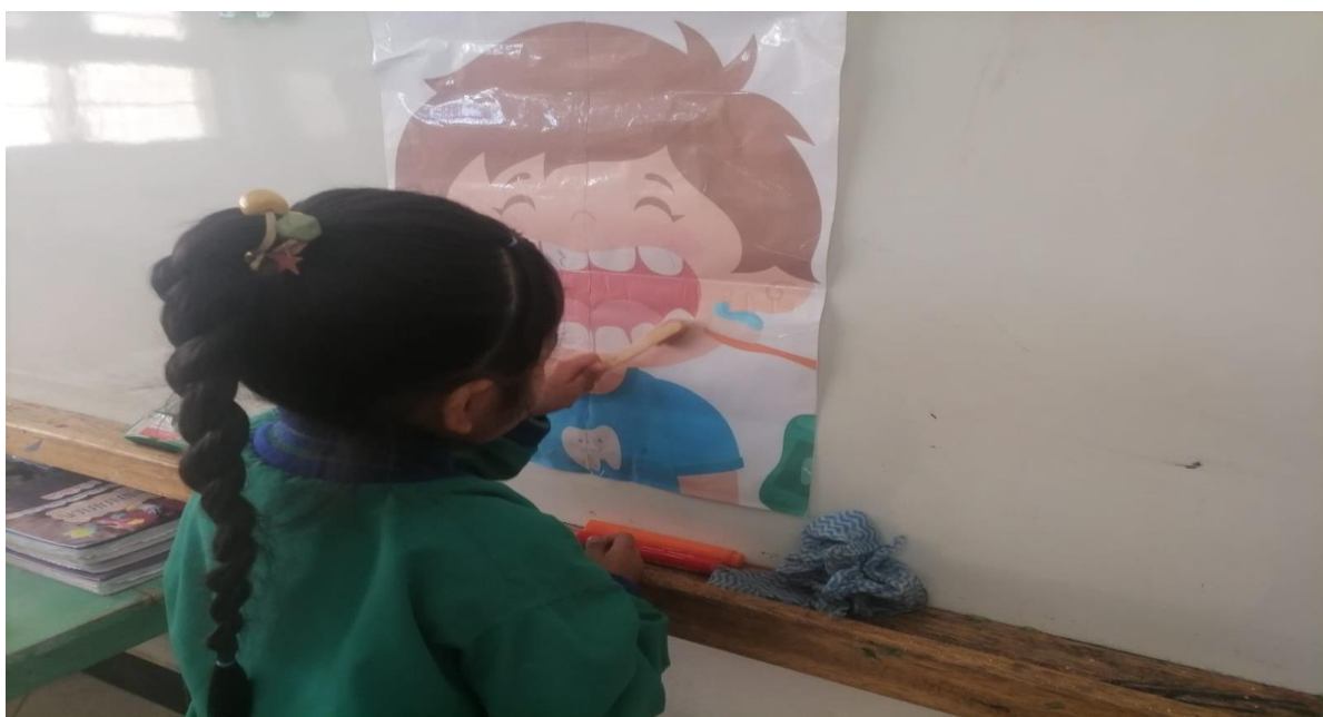
Imagen N°5: Taller “Yo cuido mis dientes”