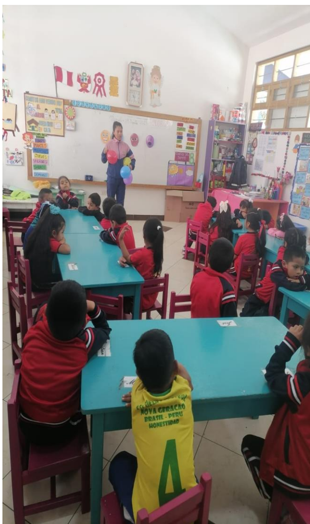
Imagen N°10: Taller “Globos de las emociones”