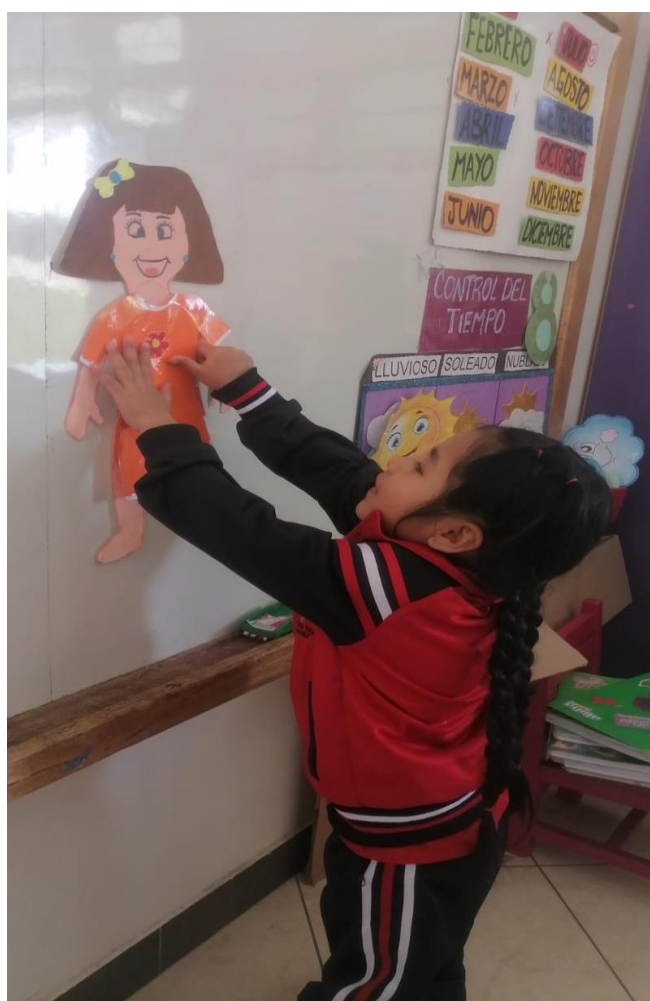
Imagen N°8: Taller “Me divierto vistiendo y desvistiendo”