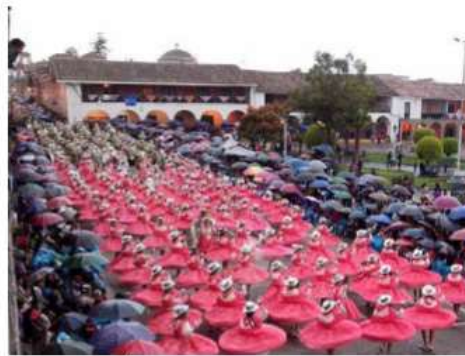
Derroche de color y alegría.

«Los killus son los frutos con las que se realizan