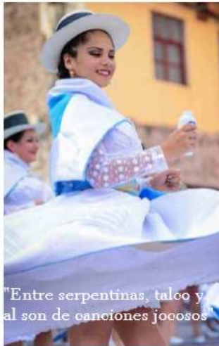
«Entre serpentinas, talco y al son de cánciones jocosos»