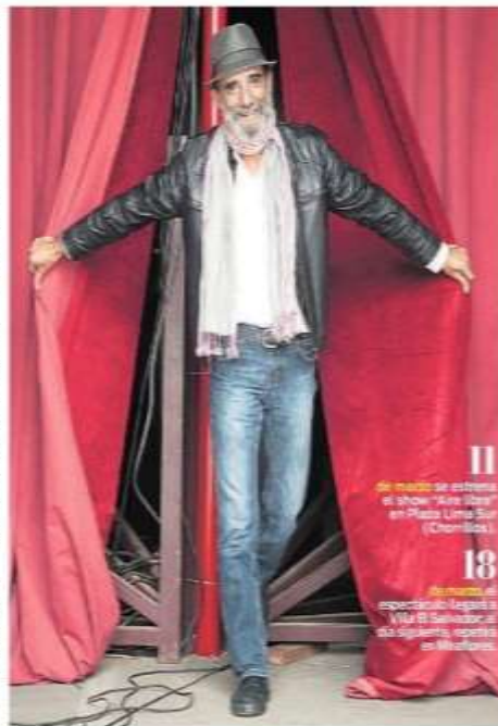
11 de marzo se estrena el show "Arte libre" en Plaza Lima Sur (Chorrillos). 18 de marzo se estrena el espectáculo itinerante "Arte libre" en Miraflores.